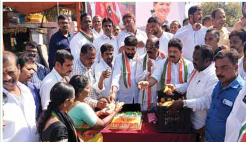
రహ్మాత్ నగర్ , మేజర్ న్యూస్: తెలంగాణ ప్రజల అభిష్టాన్ని గౌరవిస్తూ ఎన్ని ఇబ్బందులు ఎదురైనా బెరవకుండా ప్రత్యేక రాష్ట్రాన్ని బహుమతిగా ఇచ్చి కాంగ్రెస్ పార్టీ జాతీయ అధ్యక్షురాలు సోనియాగాంధీ తెలంగాణ ప్రజల మనసులు గెలుచుకున్నారని ఆ పార్టీ నేతలు పేర్కొన్నారు.