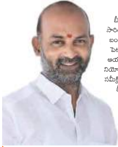
సూర్య కరీంనగర్ ప్రతినిధి

బీజేపీ జాతీయ ప్రధాన కార్యదర్శి, ఎంపీ బండి సంజయ్ కుమార్ పార్లమెంట్ ఎన్నికలపై ద్రుష్టి సారించారు. రాజీయే ఎన్నికల్లో కరీంనగర్ పార్లమెంట్ నియోజకవర్గం నుండి పోటీ చేసేందుకు సిద్ధమైన బండి సంజయ్ అందులో భాగంగా తన పార్లమెంట్ పరిధిలోని 7 అసెంబ్లీ నియోజకవర్గాలపై ఫోకస్ పెట్టారు. ప్రస్తుతం పార్లమెంట్ సమావేశాల్లో బీజేపీ ఉన్న బండి సంజయ్ ఆ సమావేశాల అనంతరం ఆయా అసెంబ్లీ నియోజకవర్గాల వారీగా నాయకులు, కార్యకర్తలతో భేటీ కానున్నారు. అందుకోసం నియోజకవర్గాల వారీగా విస్తృతస్థాయి సమావేశాలు ఏర్పాటు చేసి అసెంబ్లీ ఎన్నికల ఫలితాల సరళిపై సమీక్షించనున్నారు. ఆయా అసెంబ్లీ నియోజకవర్గాల్లో ఏ మండలాలు, గ్రామాలు, పోలింగ్ కేంద్రాల్లో బీజేపీకి అధిక ఓట్లు వచ్చాయి? ఏయే గ్రామాల్లో పార్టీ సంస్థాగతంగా బలంగా ఉంది? పార్టీ అత్యంత బలహీనంగా ఉన్న మండలాలు, గ్రామాలు ఎక్కడెక్కడ ఉన్నాయి? అక్కడ పార్టీకి వచ్చిన ఓట్ల శాతం ఎంత? అనే అంశంపై లోతుగా విశ్లేషించనున్నారు. అసెంబ్లీ నియోజకవర్గాల సమీక్ష పూర్తయిన అనంతరం మండలాల వారీగా పార్టీ కార్యకర్తలతో సమీక్షలు చేయనున్నారు. కరీంనగర్ పార్లమెంట్ నియోజకవర్గం 5 జిల్లాల్లో విస్తరించింది. మొత్తం 40 మండలాలు, 671 గ్రామాలు ఈ నియోజకవర్గ పరిధిలో ఉన్నాయి. మొత్తం 16,51,534 మంది మంది