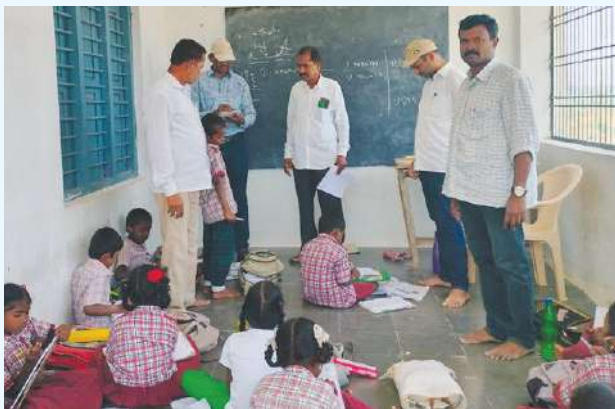
తరగతి గదిలో విద్యార్థుల వర్క్ షీట్లు పరిశీలిస్తున్న బృందం సభ్యులు