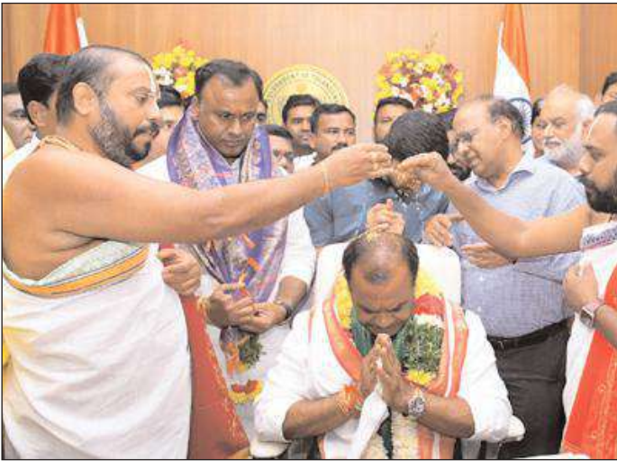
నల్గొండ జిల్లా బ్యూరో

నచివాలయంలో తన చాంబర్ లో ప్రత్యేక పూజలు ముఖ్యమైన పైక్ష మీద సంతకాలు చేసిన కోమటిరెడ్డి