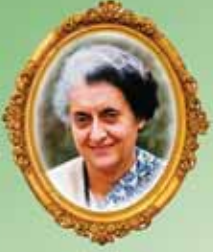
Smt Indira Gandhi