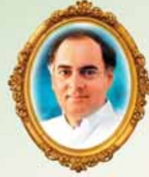
Shri Rajiv Gandhi