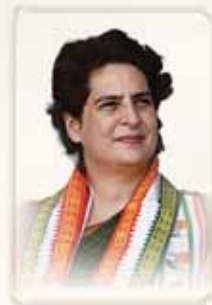
Smt. Priyanka Gandhi Vadra