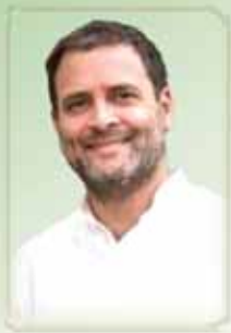
Shri Rahul Gandhi