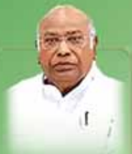
Shri Mallikarjun Kharge President, Indian National Congress