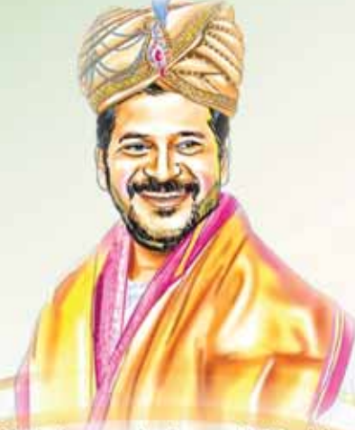
Shri Anumula Revanth Reddy Chief Minister, Telangana