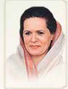
Smt. Sonia Gandhi