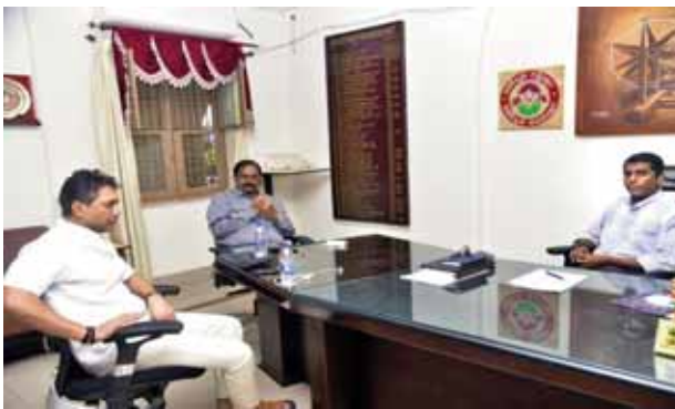
-కలెక్టర్ ను కోరిన ఎమ్మెల్యే మేకపాటి

అత్యుక్తారు,మేజర్ న్యూస్: ఆత్మకూరు నియోజకవర్గంలో ఇటీవల తుఫాన్