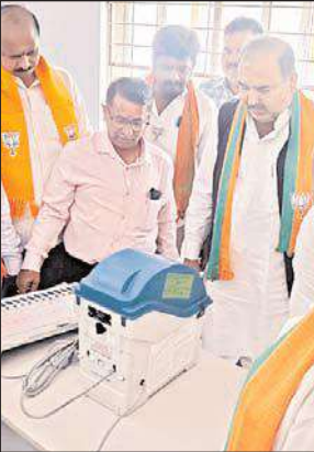
ఓటింగ్ నిర్వహించడ మైనది ఈ కార్యక్రమం నందు చిన్న కొడమగుండ్ల గ్రామం నందు వికసిత

కారంపూడి, మేజర్ న్యూస్: ఎన్నికల కమిషన్ వారి ఆదేశాల మేరకు రానున్న సార్వత్రిక ఎన్నికలు 2024లో భాగంగా జనవరి నెల 10వ తేదీ లోపు మండలంలోని ప్రతి గ్రామాల్లో ఎలక్ట్రానిక్ ఓటింగ్ యంత్రాలపై ప్రజలకు అవగాహన కల్పించవలసినదిగా ఆదేశించుండగా వారి ఆదేశాల మేరకు ఈరోజు మొదటిగా కారంపూడి మండలం చిన్న కొడమగుండ్ల గ్రామ సచివాలయం నందు సుమారు వందమంది ఓటర్లు సమక్షంలో తహసీల్దారు. కారంపూడి వారు అవగాహన సదస్సును నిర్వహించి వారిచే తెల్ల కాగితం తో దమ్మి