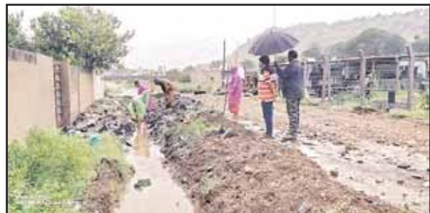
పాపింగ్ మాల్ దగ్గర రోడ్లపై వర్షపు నీరు ఎక్కువగా నిలిచి ఉండడం గమనించి దగ్గరుండి వర్కప్ తో తొలగించే చర్యలను పర్యవేక్షించారు. నేతాజీ కాలనీ, పాత మార్కెట్ ప్రాంతం దగ్గర రోడ్డు శుభ్రపరచడం, వర్షపు నీరు నిలువ ఉండకుండా కలువలలోకి తరలించడం కూడా పర్యవేక్షించారు. ప్రకాశం కాలనీ దగ్గర పోతురాజు కాలువలోని జమ్మిని

ఒంగోలు, మేజర్ న్యూస్: ఒంగోలు నగరములో మిచెంగ్ తుఫాను తీవ్రత దృష్ట్యా కమీషనర్ నగరముంతా విస్తృతంగా పర్యటించారు. ఒంగోలు నగరములో ఉదయము నుండి కురుస్తున్న భారీ వర్షాలు దృష్ట్యా కమీషనర్ నగరపాలక సిబ్బందిని అప్రమత్తం చేస్తూ రోడ్లపై నిలువ ఉన్న వర్షపు నీటిని కలువలలోకి తరలించే ప్రక్రియను మరియు ఎదురు గాలులకు రోడ్లపై పడిన చెట్ల కొమ్మలను తొలగించే కార్యక్రమమును దగ్గరుండి పర్యవేక్షించారు. పేర్లమిట్ట చైతన్య కాలేజీ దగ్గర కర్నూల్ రోడ్ ని ఎం ఆర్