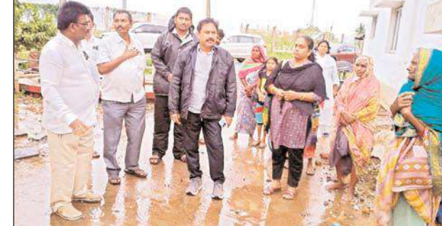
ఎప్పటికప్పుడు తొలగించాలని ఆదేశించారు. కార్యక్రమంలో సర్పంచ్, పంచాయతీ కార్యదర్శి, సిబ్బంది మరియు గ్రామస్థులు పాల్గొన్నారు.