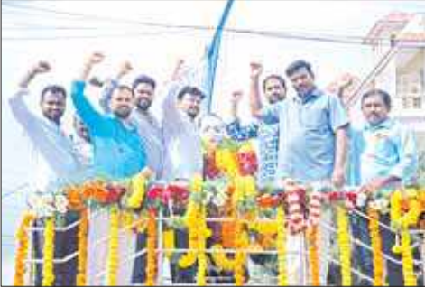
భీం రావ్ అంబేద్కర్