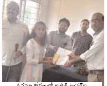
డిప్లొమా కోర్సులో కాలేజ్ టాపర్ గా బహుమానం అందుకుంటున్న ఫోటో.

నవంబర్ 25 న జరిగిన బీఎస్సీ-హార్దికల్పర్ ప్రవేశం కోసం నిర్వహించిన పరీక్ష పరీక్షలో రాశారు. ఈనెల 5నా విడుదలైన ఫలితాల్లో రాష్ట్ర స్థాయిలో రెండవ ర్యాంకు సాధించారు. విద్యార్థి సూర్యను ఉద్యాన పాల్ టెక్నిక్ కళాశాల ప్రిన్సిపల్, సిబ్బంది, నాయకులు, గ్రామస్థులు అభినందించారు.