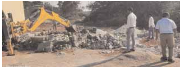
కూల్చివేతులు చేస్తున్న అధికారులు.

ఘట్టేసర్ రూరల్/ఘట్టేసర్ మేజర్ న్యూస్(డిసెంబర్ 11): ప్రభుత్వ భూమిలో అక్రమ నిర్మాణాలు చేపడితే కఠిన చర్యలు ఉంటాయని తహశిల్దార్ జి.కృష్ణ హెచ్చు రించారు. సోమవారం పోచారం మున్సిపాలిటీ పరిధి అన్నేజి గూడలోని 3/1 సర్వేనంబర్లో దాదాపు 20 వరకు బేస్మెంట్లు, ఘట్టేసర్ మున్సిపాలిటీ పరిధిలోని కొండాపూర్ సర్వే నంబర్ 2577లో పలు నిర్మాణాలను పెద్ద ఎత్తున తహశిల్దార్ కృష్ణ ఆధ్వర్యంలో రెవెన్యూ సిబ్బందితో కలిసి జేసిబి సహాయంతో కూల్చివేతుల చేపట్టారు. ఈ సందర్భంగా తహశిల్దార్ కృష్ణ మాట్లాడుతూ ప్రభుత్వ భూమిలో ఎలాంటి నిర్మాణాలు చేపట్టిన ఊరుకునేది లేదని హెచ్చరించారు.