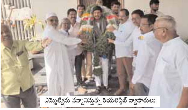
ఎమ్మెల్యేను సన్మానిస్తున్న రియలెస్టేట్ వ్యాపారులు

తాండూరు మేజర్ న్యూస్ (డిసెంబర్ 11): తాండూరు ఎమ్మెల్యే మనోహర్ రెడ్డిని సోమవారం నాడు తాండూరు పట్టణానికి చెందిన కొందరు రియలెస్టేట్ వ్యాపారులు కలిసి తాము ఎదురుకుంటున్న సమస్యలను వివరించారు. అంతకు ముందు ఎమ్మెల్యే మనోహర్ రెడ్డిని గజమాలతో పెద్ద ఎత్తున సన్మానించారు. తాండూరు ప్రాంతంలోని రియలెస్టేట్ వ్యాపారులు వివిధ సమస్యలతో ఎన్నో ఇబ్బందులు ఎదురుకుంటున్నారని, న్యాయబద్ధంగా వాటిపై ప్రత్యేక దృష్టి పెట్టి సమస్యలను పరిష్కరించాలని వారు కోరారు. భూముల లావాదేవీల్లో కొన్ని ఇబ్బందులు రావడంతో ప్రభుత్వ ఆదాయానికి గండి పడడం తోపాటు ప్లాట్లు, భూములు కొనుగోలు చేసేవారు, అమ్మకాలు జరిపేవారు కొన్ని ఇబ్బందులు పడుతున్నారని, అన్ని సమస్యలను క్లియర్ చేస్తే అందరికీ మేలు జరుగుతుందని ఎమ్మెల్యే ని కోరారు. వ్యాపారులు చెప్పిన విషయాలను ఎమ్మెల్యే మనోహర్ రెడ్డి పూర్తి వివరాలు తెలుసుకొని సానుకూలంగా స్పందించారు. దీంతో వ్యాపారస్తులు సంతోషం వ్యక్తం చేశారు. ఎమ్మెల్యే ను కలిసిన వారిలో రియలెస్టేట్ వ్యాపారులు: