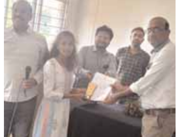
డిప్లొమా కోర్సులో కాలేజీ టాపర్ గా బహుమానం అందుకుంటున్న ఫోటో.