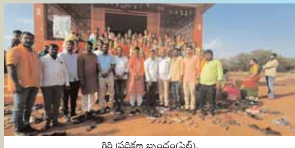
గిరి ప్రదక్షిణ బృందం(ఫైల్).

వికారాబాద్ జిల్లా కేంద్రంలోని అనంతగిరి లోగల ప్రముఖ శ్రీ అనంత పద్మనాభ స్వామి దేవాలయ పరిరక్షణే తమ ముఖ్య ఉద్దేశమని భారతీయ జనతా పార్టీ