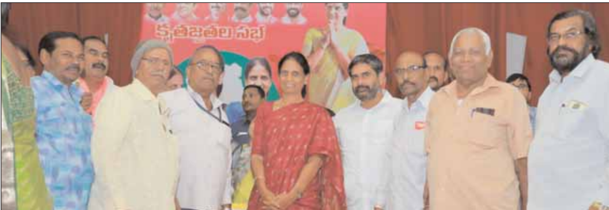
బాలాపూర్ మేజర్ స్కూల్ (డిసెంబర్ 15);

▶ కార్యకర్తలందరూ సబితా ఇంద్రారెడ్డిని కలిసి అభినందనలు తెలిపారు ▶ శాసనసభ్యురాలుగా బాధ్యతగా పనిచేస్తూ ▶ మహేశ్వరం నియోజకవర్గ శాసన సభ్యురాలు సబితా ఇంద్రారెడ్డి