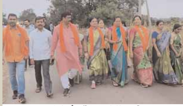
గిరి ప్రదక్షిణలో పాల్గొన్న మహిళ భక్తులు(ఫైల్).