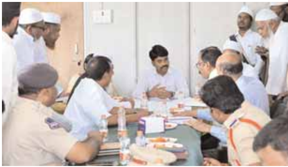
అధికారులు, మత పెద్దలతో మాట్లాడుతున్న జిల్లా కలెక్టర్ నారాయణ రెడ్డి.

పరిగి మేజర్ న్యూస్ (డిసెంబర్ 15): పరిగిలో నిర్వహించే ఇస్తేమ కార్యక్రమానికి డిసెంబర్ 30లోగా ఏర్పాట్లన్ని పూర్తి చేయాలని వికారాబాద్ జిల్లా కలెక్టర్ సి.నారాయణ రెడ్డి అధికారులను ఆదేశించారు. జనవరి 6 నుండి 8 వరకు మూడు రోజుల పాటు నిర్వహించే ఇస్తేమ కార్యక్రమానికి సంబంధించిన ఏర్పాట్లను శుక్రవారం ముస్లిం మత పెద్దలు, అధికారులతో కలిసి క్షేత్రస్థాయిలో పరిశీలించారు. ఈ సందర్భంగా కలెక్టర్ మాట్లాడుతూ... అధికారులు, మత పెద్దలు సమన్వయంతో పనిచేస్తూ ఇస్తేమ కార్యక్రమం విజయవంతంగా జరిగేలా కృషి చేయాలన్నారు. ఇస్తేమ కార్యక్రమానికి లక్షలాది మంది హాజరు అవుతున్న నేపథ్యంలో డివైడర్లతో కూడిన విస్తీర్ణమైన రోడ్లను ఏర్పాటు చేయాల్సి ఉంది. ట్రాఫిక్ అంతరాయం కాకుండా పార్కింగ్ స్థలాలను గుర్తించాలని పోలీస్ అధికారులను కలెక్టర్ ఆదేశించారు. ఇస్తేమ కార్యక్రమం విజయవంతం దిశగా అధికారులందరూ సమన్వయంతో పని చేయాలని కలెక్టర్ అధికారులకు ఆదేశించారు.