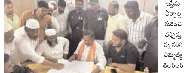
ఇస్తేమ ఏర్పాట్ల గురించి చర్చిస్తున్న పరిగి ఎమ్మెల్యే టిఆర్ఆర్

ఇస్తేమ ఏర్పాట్లను పరిశీలించిన పరిగి ఎమ్మెల్యే టిఆర్ఆర్ పరిగి మేజర్ న్యూస్ (డిసెంబర్ 15): పరిగి మున్సిపల్ పరిధిలోని న్యాయ్ నగర్ సమీపంలో నిర్వహిస్తున్న రెండు రాష్ట్రాల్లో దీని ఇస్తేమ ఏర్పాట్లను శుక్రవారం పరిగి ఎమ్మెల్యే డాక్టర్ టి. రాంమోహన్ రెడ్డి పరిశీలించారు. ఈ సందర్భంగా ఆయన మాట్లాడుతూ... ఇస్తేమ కార్యక్రమానికి ప్రభుత్వం తరఫున రూ. 2.45 కోట్లు నిధులను మంజూరు చేయించినట్లు తెలిపారు. ఈ కార్యక్రమానికి ఇంకా ఎలాంటి అవసరం ఉన్నా ప్రభుత్వం తరఫున అందించడానికి సిద్ధంగా ఉన్నామని పేర్కొన్నారు. ఈ కార్యక్రమంలో నిర్వహకులు, మైన్స్ట్రీ నాయకులు, పాల్గొన్నారు.