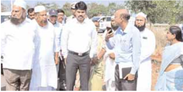
ఇస్తేమ కార్యక్రమ ఏర్పాట్లను పరిశీలిస్తున్న జిల్లా కలెక్టర్ నారాయణ రెడ్డి.

పరిగి మేజర్ న్యూస్ (డిసెంబర్ 15): పరిగిలో నిర్వహించే ఇస్తేమ కార్యక్రమానికి డిసెంబర్ 30లోగా ఏర్పాట్లన్ని పూర్తి చేయాలని వికారాబాద్ జిల్లా కలెక్టర్ సి.నారాయణ రెడ్డి అధికారులను ఆదేశించారు. జనవరి 6 నుండి 8 వరకు మూడు రోజుల పాటు నిర్వహించే ఇస్తేమ కార్యక్రమానికి సంబంధించిన ఏర్పాట్లను శుక్రవారం ముస్లిం మత పెద్దలు, అధికారులతో కలిసి క్షేత్రస్థాయిలో పరిశీలించారు. ఈ సందర్భంగా కలెక్టర్ మాట్లాడుతూ... అధికారులు, మత పెద్దలు సమన్వయంతో పనిచేస్తూ ఇస్తేమ కార్యక్రమం విజయవంతంగా జరిగేలా కృషి చేయాలన్నారు. ఇస్తేమ కార్యక్రమానికి లక్షలాది మంది హాజరు అవుతున్న నేపథ్యంలో డివైడర్లతో కూడిన విస్తీర్ణమైన రోడ్లను ఏర్పాటు చేయాల్సి ఉంది. ట్రాఫిక్ అంతరాయం కాకుండా పార్కింగ్ స్థలాలను గుర్తించాలని పోలీస్ అధికారులను కలెక్టర్ ఆదేశించారు. ఇస్తేమ కార్యక్రమం విజయవంతం దిశగా అధికారులందరూ సమన్వయంతో పని చేయాలని కలెక్టర్ అధికారులకు ఆదేశించారు.