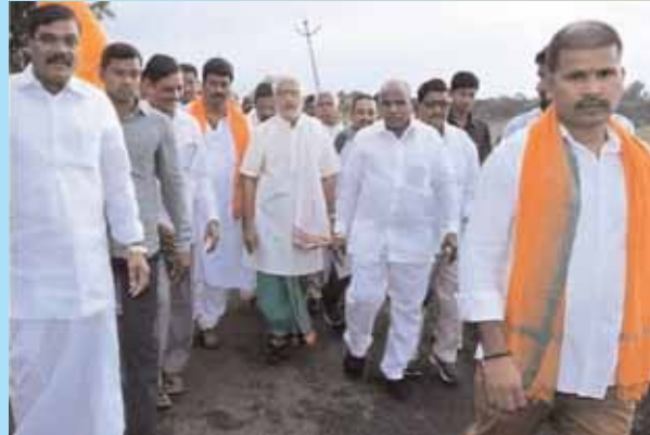
అనంతగిరి గిరి ప్రదక్షిణ చేస్తున్న దృశ్యం(ఫైల్).