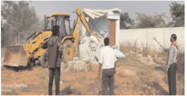
అక్రమంగా నిర్మించిన ఇండ్లను కూల్చివేసిన రెవెన్యూ అధికారులు.