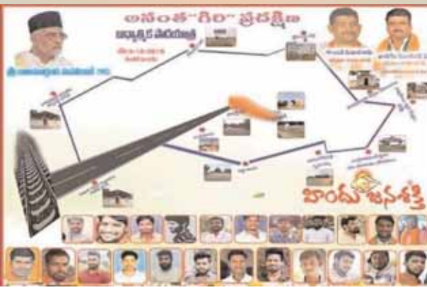
గిరి ప్రదక్షిణ రూట్ మ్యాప్.

అనంత పద్మనాభ స్వామిని దర్శించుకుంటారు. ఇలా సుమారు 25 కిలోమీటర్ల మేర పాదయాత్ర చేసి గిరి ప్రదక్షిణ కార్యక్రమాన్ని పూర్తి చేస్తారు.