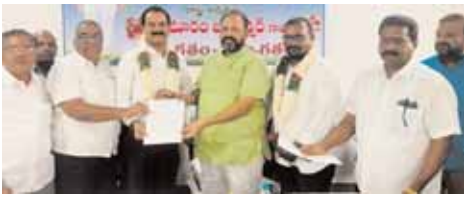
నియమాక పత్రం అందజేస్తున్న దృశ్యం