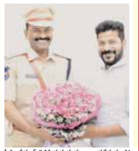
సీఎం రేవంత్ రెడ్డికి పుష్పగుచ్ఛం అందజేస్తున్న ఎస్పీ