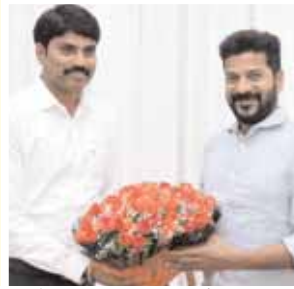
సీఎం రేవంత్ రెడ్డికి పుష్పగుచ్ఛం అందజేస్తున్న కలెక్టర్