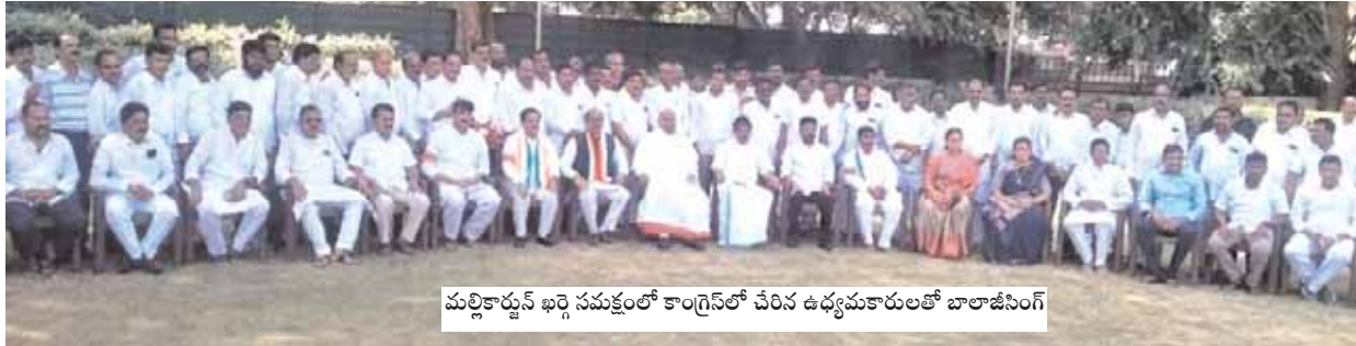
మల్లికార్జున్ ఖర్గె సమక్షంలో కాంగ్రెస్ లో చేరిన ఉద్యమకారులతో బాలాజీసింగ్