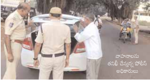
వాహనాలను తనిఖీ చేస్తున్న పోలీస్ అధికారులు

వికారాబాద్ జిల్లా ప్రతినిధి, మేజర్ న్యూస్ (డిసెంబర్ 18) జిల్లా లోని పోలీస్ అధికారులు ప్రతి ఒక్కరు తమ తమ పోలీస్ స్టేషన్ ల పరిధిలో నాఖబంది కార్యక్రమం చేపట్టారు. ఈ సందర్భంగా జిల్లా ఎస్పీ ఎన్.కోటిరెడ్డి మాట్లాడుతూ... నాఖబందిలో పోలీస్ అధికారులు జిల్లాలో మొత్తం 1332ల వాహనాలు సీజ్ చేసినట్లు వారు తెలిపారు. అందులో ద్వి చక్ర వాహనాలు 487, త్రి చక్ర వాహనాలు 188, నాలుగు చక్రాల వాహనాలు 462, ఇతర వాహనాలు 190 ఉన్నాయన్నారు. కావున జిల్లా ప్రజలు ఎల్లప్పుడు పోలీస్ అధికారులకు సహకరించి జిల్లాలో శాంతిభద్రతలు కాపాడుటలో తమ వంతు సహాయసహకారాలు అందించాలని, జిల్లాలో చట్ట వ్యతిరేఖ, అసాంఘిక కార్యకలాపాలను అరికట్టుటకు ఎప్పుడైనా జిల్లాలో నాఖబంది, కార్టెన్ - సర్వీ, వెహికల్ చెకింగ్ మొదలగు కార్యకలాపాలు చేయడం జరుగుతుందన్నారు. జిల్లా ప్రజలు ఇట్టి విషయం పై దృష్టి సరిచి పోలీస్ అధికారులకు సహకరించాలని మనవి అని జిల్లా ఎస్పీ నంద్యాల కోటి రెడ్డి తెలిపారు.