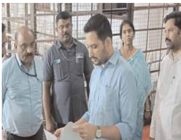
ఉప్పల్ కు 20 టేబుల్స్:

జిల్లాలోని ఉప్పల్ నియోజక వర్గం లోని 418 పోలింగ్ కేంద్రాలకు చెందిన ఓట్లను 21 రౌండ్స్ లలో కౌంటింగ్ చేయనున్నారు. ఇందు కోసం 20 టేబుల్స్ ఏర్పాటు చేశారు. పోస్టల్ బ్యాలెట్ కౌంటింగ్ కు 2 టేబుల్స్ ఏర్పాటు చేశారు. ఈ సారి పోస్టల్ బ్యాలెట్ కు ప్రత్యేకంగా టేబుల్లు ఏర్పాటు చేస్తున్నారు. 500 ఓట్లకు ఒకటి చొప్పున టేబుల్లను ఏర్పాటు చేస్తున్నారు. ఈ సారి ఐదు నియోజకవర్గాలకు గాను దాదాపు 9,889 పోస్టల్ బ్యాలెట్లు వినియోగించుకున్నారు. పటిష్టమైన ఏర్పాట్లు పూర్తి...కలెక్టర్ గౌతం: జిల్లాలోని ఓట్ల లెక్కింపుకు అన్ని ఏర్పాట్లు చేశామని కలెక్టర్ తెలిపారు. ఇందుకు గాను పటిష్టమైన బందోబస్తును ఏర్పాటు సర్వం సిద్ధం చేశామన్నారు. సి.సి.కెమెరాల నిఘా నీడలో ఓట్ల లెక్కింపు జరుగుతుందని, దీనిని అబ్జర్వర్లు, మైక్రో అబ్జర్వర్లు అనునిత్యం పర్యవేక్షణ చేస్తారని కూడా ఆయన పేర్కొన్నారు.