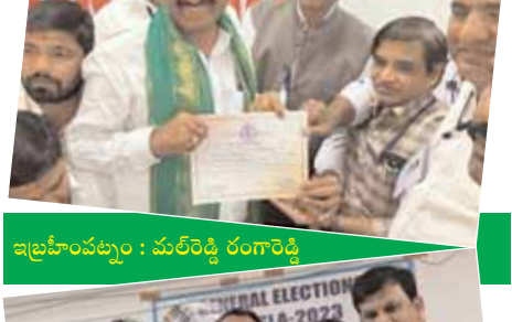
ఇబ్రహీంపట్నం : మల్లెరెడ్డి రంగారెడ్డి