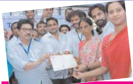
మహేశ్వరం : చలోళ్ల సచివారెడ్డి