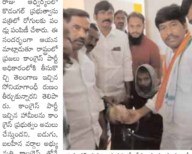
కొడంగల్ ప్రభుత్వ ఆస్పత్రిలో రోగులకు పండ్లు పంపిణీ చేస్తున్న కాంగ్రెస్ నాయకులు