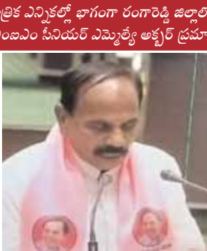
కాలి యానయ్య వేవళ్ల