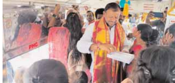
మహిళలకు స్వీట్లు పంపిస్తున్న దృశ్యం.

గా స్వీట్లు పంపిణీ చేసి సంబరాలు నిర్వహించారు. అనంతరం వారితో పాటు బస్సు లో ప్రయాణించారు. ఈ సందర్భంగా వజ్రేష్ యాదవ్ మాట్లాడుతూ... కాంగ్రెస్ పార్టీ మాట ఇస్తే తప్పదని, ఇచ్చిన 6 గ్యారంటీ పథకాలు 100 రోజులలో అమలు చేస్తామని చెప్పి కేవలం రెండు రోజుల్లోనే రాష్ట్ర ముఖ్యమంత్రి రేవంత్ రెడ్డి ప్రకటించడం కాంగ్రెస్ పార్టీ చిత్తశుద్ధికి నిదర్శనమని వారు పేర్కొన్నారు. అదేవిధంగా ఆరోగ్యశ్రీ పథకం కింద పేదలకు 10 లక్షల రూపాయలు పెంచు తూ.. అన్ని అనువులకు ఆదేశాలు జారీ చేయడం మధ్యతరగతి కుటుంబాలకు ఎంతో మేలు జరుగుతుందన్నారు. మిగిలిన గ్యారంటీ పథకాలను కూడా రానున్న రోజుల్లో కాంగ్రెస్ పార్టీ అమలు చేస్తుందన్నారు. ఈ కార్యక్రమం లో మేధల్ నియోజకవర్గం ఏ, బి బ్లాక్ అధ్యక్షులు, మండల్ మున్సిపల్, కార్పొరేషన్ అధ్యక్షులు, సీనియర్ నాయకులు, వైస్ ఎంపీపీ, సర్పంచులు, కౌన్సిలర్లు, కార్పొరేటర్లు, కంట్రాస్టర్ కౌన్సిలర్లు కార్పొరేటర్లు, మాజీ ప్రజా ప్రతినిధులు, యూత్ కాంగ్రెస్, మహిళా కాంగ్రెస్, ఎస్సీ సెల్, బీసీ సెల్, మైనారిటీ సెల్, సీవ్ దక్.ఎస్సీ సెల్, ఎన్ఎస్యూఐ, నాయకులు కార్యకర్తలు అధిక సంఖ్యలో పాల్గొన్నారు.