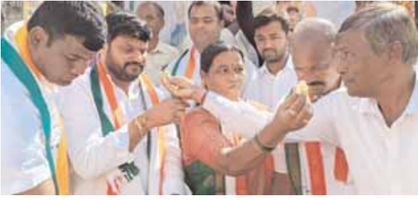
అంబేద్కర్ కూడలిలో కేక్ కట్ చేస్తున్న దృశ్యం

ఘట్ కేసర్, మేజర్ న్యూస్ (డిసెంబర్, 09): కాంగ్రెస్ అగ్రనేత సోనియా గాంధీ జన్మదిన వేడుకలను ఘట్ కేసర్ పట్టణంలో శనివారం ఘనంగా నిర్వహించారు. అంబేద్కర్ చౌరస్తాలో ఘట్ కేసర్ మున్సిపల్ కాంగ్రెస్ అధ్యక్షులు మామిండ్ల ముత్యాల యాదవ్ ఆధ్వర్యంలో నిర్వహించిన ఈ కార్యక్రమానికి మాజీ సర్పంచ్