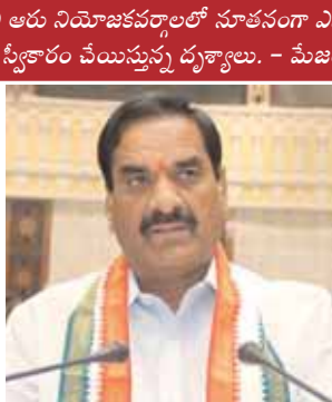
మల్ రెడ్డి రంగారెడ్డి ఇబ్రహీంపట్నం