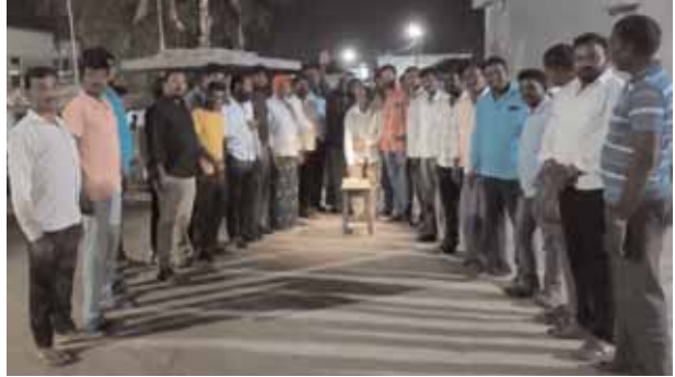
జన్మదిన వేడుకల్లో పాల్గొన్న కాంగ్రెస్ నాయకులు