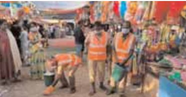
జాతరలోని చెత్తాచెదారాన్ని శుభ్రం చేస్తున్న గ్రామ పంచాయతీ కార్మికులు.

పంచాయతీరాజ్ సిబ్బంది ధారూర్ ఎంపీఓ షేషి ఉల్లా తో పాటు పూడూర్, కోట్పల్లి ఎంపీ ఓలు ఈ జాతరలో విధులు నిర్వహిస్తున్నారు. వీరితో పాటు ధారూర్, కోట్ పల్లి, యాలాల్ మండలాలకు చెందిన పంచాయతీ కార్యదర్శులు 52 మంది, వివిధ గ్రామాల పారిశుధ్య కార్మికులు 64 మంది మొత్తం ఒక 122 మంది సిబ్బంది ఈ మెథడిస్ట్ జాతరలో భక్తుల సౌకర్యార్థం పనిచేస్తూ ఉన్నారు. పోలీస్ సిబ్బంది జాతరకు వచ్చే భక్తులను అదుపు చేస్తూ వారికి సౌకర్యాన్ని కల్పిస్తున్నారు. వీరే కాకుండా ఇతర శాఖల సిబ్బంది కూడా జాతరకు వచ్చే భక్తుల కోసం సౌకర్యాన్ని కల్పిస్తున్నారు. ఈ జాతరకు వేల లక్షల సంఖ్యలో భక్తులు వచ్చి ముడుపులు చెల్లిస్తూ ఉంటారు. అయినప్పటికీ భక్తులకు జాతర నిర్వాహకులు ఎలాంటి సౌకర్యాల కల్పించకుండా ఇక్కడ వచ్చిన ఆదాయాన్ని ఎక్కడికో తీసుకు వెళుతున్నారు. కాని ఇక్కడ మాత్రం ఎలాంటి అభివృద్ధి చేపట్టడం లేదని చుట్టుపక్కల గ్రామస్థులు ఆవేదన వ్యక్తం చేస్తున్నారు. జాతర ముగిసిన తర్వాత చెత్తాచెదారంతో మలమూత్రాలతో పరిసర ప్రాంతాలు నిండిపోవడంతో దుర్వాసన వస్తోందని గత ఏడాది కూడా స్టేషన్ ధారూర్, దోర్నాల గ్రామపంచాయతీలకు జాతర నిర్వాహకులు పరిశుభ్రం చేసేందుకు ఎలాంటి నిధులు ఇవ్వకుండా వాళ్లిపోయారని ఇప్పటికైనా అధికారులు స్పందించి గ్రామపంచాయతీలకు కొంత వాటాను కల్పించాలని ఆవేదన వ్యక్తం చేశారు.