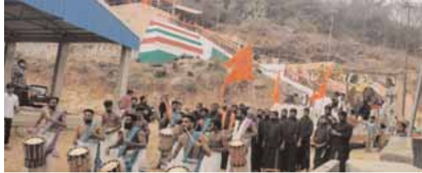
వైభవంగా అయ్యప్ప స్వామి పల్లకి సేవ

కుల్చుచర్ల మేజర్ న్యూస్(డిసెంబర్ 17): అన్నదాన ప్రభువే శరణమయ్యప్ప అయ్యం గారయ్యావే శరణమయ్యప్ప స్వామి శరణం అయ్యప్ప శరణం అంటూ అయ్యప్పస్వామి దీక్ష చేపట్టిన స్వాములుఅయ్యప్ప స్వామి పల్లకి సేవను అత్యంత భక్తి శ్రద్ధలతో ఊరేగింపులు నిర్వహించారు. మండల కేంద్రంలోని అయ్యప్ప కొండ నుండి మైలమ్మ చెరువుల దగ్గర ఉన్న హనుమాన్ దేవాలయం వరకు అయ్యప్ప స్వామి పల్లకి సేవను ఊరేగింపును నిర్వహించారు. అయ్యప్ప స్వామి నామస్మరణతో కేరళ వైద్యాలతో, మేళా తాళాలతో డప్పుల వాయిద్యాలతో అయ్యప్ప స్వామి పల్లకి సేవ అంగరంగ వైభవంగా నిర్వహించారు. అయ్యప్ప స్వామి పల్లకి సేవతో పాటుమైలమ్మ చెరువులోని నీటితో నిండిన కలశాన్ని తీసుకువచ్చి