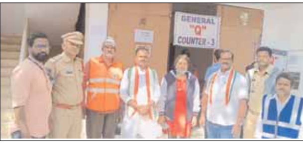
సీతాఫలమండి, మేజర్ న్యూస్: సికింద్రాబాద్ నియోజకవర్గం పరిధిలో వివిధ మున్సిపల్ డివిజన్లకు సంబంధించిన కళ్యాణ లక్షి చెక్కులను ఎమ్మెల్యే