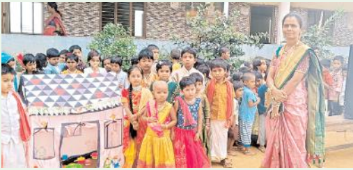
వెల్దురి, మేజర్స్ న్యూస్

వెల్దురిలోని హాలిక ఈ టెక్స్ట్ స్కూల్లో సంక్రాంతి సంబరాలు ఘనంగా జరిగాయి. ఈ సందర్భంగా పాఠశాల ఆవరణలో విద్యార్థులకు ముగ్గులు పోటీలు నిర్వహించారు. భోగి మంటలు వేసి కోలాటాన్ని ప్రదర్శించారు. ఈ సందర్భంగా పాఠశాల డైరెక్టర్ హాలిక మాట్లాడుతూ తెలుగువారి సాంస్కృతిక సాంప్రదాయాలు కాపాడేలా ప్రతి సంవత్సరం సంక్రాంతి సంబరాలను తమ పాఠశాలలో నిర్వహిస్తూ విద్యార్థులకు తెలుగు సాంప్రదాయాన్ని తెలియజేస్తున్నామన్నారు. ఈ కార్యక్రమంలో పాఠశాల ఉపాధ్యాయుని ఉపాధ్యాయులు విద్యార్థిని విద్యార్థులు వారి తల్లిదండ్రులు పాల్గొన్నారు.