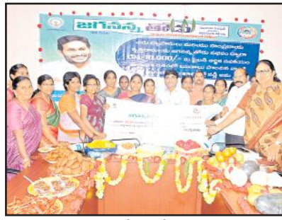
నరసరావుపేట, మేజర్ న్యూస్