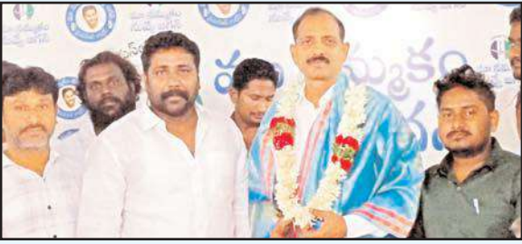
నరసరావుపేట, మేజర్ న్యూస్