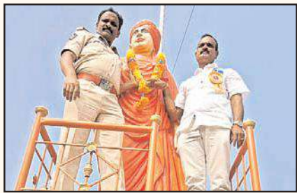
శ్రీ రామకృష్ణ సేవాసమితి ఆధ్వర్యంలో.... మాచర్ల టౌన్, మేజర్ న్యూస్