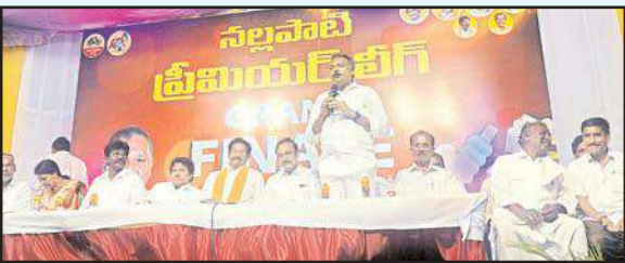
నరసరావుపేట మేజర్ న్యూస్