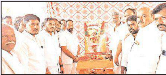
మాచర్ల టౌన్, మేజర్ న్యూస్