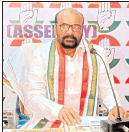
ఉద్యోగాలు చేస్తున్న అంగన్వాడీలు మీ తాటాకు చప్పుళ్లకు భయ పడరని, మీ బెదిరింపులకు, తలవంగరన్నారు. మీ ప్రభుత్వానికి బుద్ధి చెప్పే వరకు వారు సమైక్య విరమించబోరని, వారి న్యాయమైన