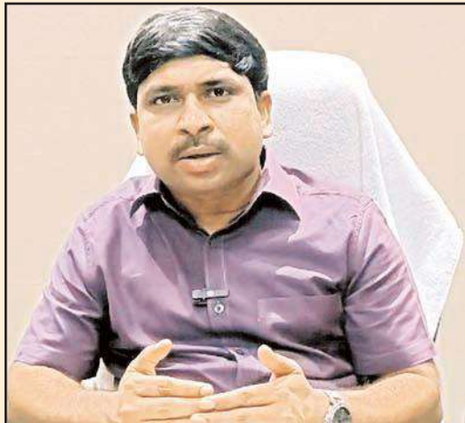
నరసరావుపేట మేజర్ న్యూస్: