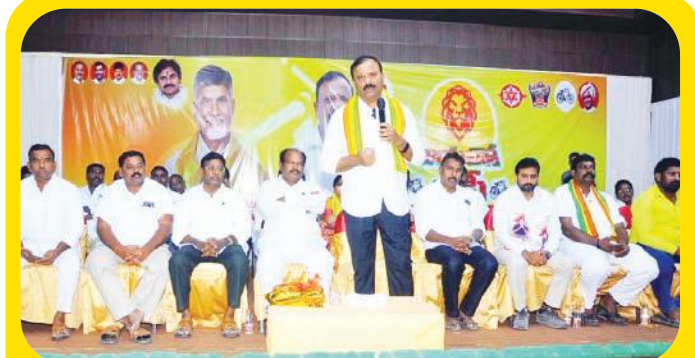
టీడిపిలోనే బీసీల అభివృద్ధి - 3వ పేజీలో

నేటి దినపత్రిక సూర్య బ్యూరో, పల్నాడు జిల్లా రాష్ట్ర రాజకీయాల మారే విధంగా తొలి రోజే వైఎస్ షర్మిలా సిక్వర్ కొట్టిందా.. అన్న సందేహాలు వ్యక్తమవుతున్నాయి. ప్రభుత్వ వ్యతిరేక ఓట చీలకూడడన్న భావనతో జనసేన, టిడిపి కలిసి వైసిపిని గద్దెదింపాలన్న వ్యూహంలో భాగంగా రెండు కలిసి ప్రయాణం మొదలు పెట్టాయి. ఈ నేపథ్యంలో అకస్మాత్తుగా కాంగ్రెస్ వైఎస్ షర్మిలను రంగంలోకి దించింది. ఇప్పటికీ వరకు సుప్రావస్థలో ఉన్న కాంగ్రెస్కు జవజీవాలు వచ్చినట్లుగా భావిస్తున్నారు. ఈ క్రమంలో రాష్ట్ర రాజకీయం ఒక్కసారిగా తర్రు అవుతున్నట్లు రాజకీయ విశ్లేషకులు అభిప్రాయ పడుతున్నారు. ఇప్పటి వరకు ఒక ఎత్తు ఇక నుంచి ఒకవత్తు అనే విధంగా రాజకీయ సమీకరణాలు మారుతున్నాయి. ఇదిలావుండగా, ఆదివారం మిగతా 3వ పేజీలో