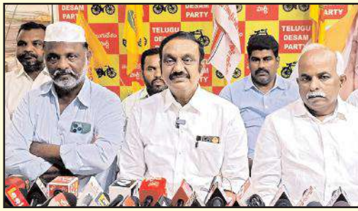
నరసరావుపేట మేజర్ న్యూస్