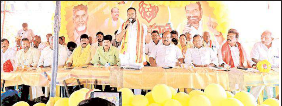
మాచర్ల, మేజర్ న్యూస్: