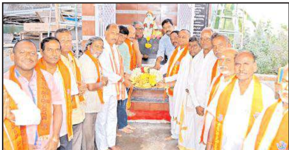
వినుకొండ, మేజర్ న్యూస్