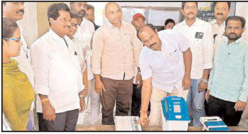
పిడుగురాళ్ల టౌన్, మేజర్ న్యూస్