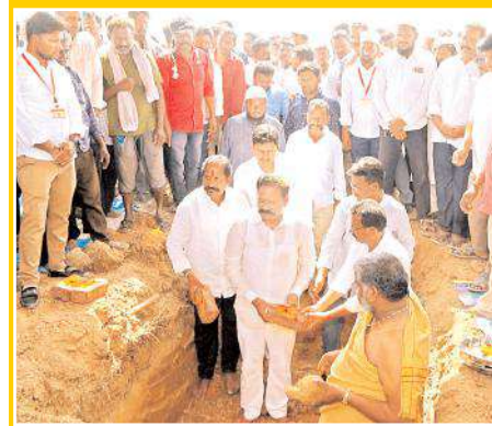
కాజా ట్రెజరర్ షరీఫ్ జాయింట్ సెక్రటరీ బాజీ, మోటర్ వర్కస్ పాల్గొన్నారు.