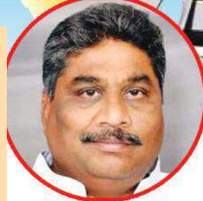
సాటి దినపత్రిక సూర్య బ్యూరో, పల్నాడు జిల్లా

వైసీపీ 175 అంటూ ఎన్నికల రణక్షేత్రంలోకి దూకుతోన్న వైసీపీ అధిష్టానం అభ్యర్థులు ఎంపిక విషయంలో చేపడుతోన్న వ్యూహాత్మక చర్యలతో సిటింగ్ ఎమ్మెల్యేలను భయ కంపితులను చేస్తోంది. తాడేపల్లి సిఎంవో కార్యాలయం నుంచి ఛోస్ వచ్చిందంటే ఎమ్మెల్యేల గుండె గుబేలు మంటోంది. ఈనేపథ్యంలో అభ్యర్థులు ఎంపిక విషయంలో అధినేత జగన్మోహన్ రెడ్డి చేపడుతోన్న చర్యలు కొందరిలో మోదాన్ని కలిగిస్తే మరి కొందరిలో భేదాన్ని కలిగిస్తున్నాయి. ఐ ప్యాక్ తోపాటు మరో ఐదు నర్సరావుపేట ప్రామాణికంగా పెట్టుకుని అభ్యర్థులను ఎంపిక చేయడం, సిటింగ్ లను మార్చడం లాంటి చర్యలు చేపడుతున్నారు. ఇప్పటికే కొందరు ఎంపిలను రద్దీ చేసిన వైసీపీ అధిష్టానం కొన్న ఎంపీ సీట్లపై సందిగ్గంలో ఉన్నట్లు తెలుస్తోంది. ముఖ్యంగా పల్నాడు జిల్లాకు సంబంధించిన నర్సరావుపేట పార్లమెంట్ నియోజవర్గంపై ముఖ్యమంత్రి ఛోకస్ పెట్టినట్లు సమాచారం అందుతోంది. ఈనేపథ్యంలో శుక్రవారం పల్నాడు ఎమ్మెల్యేలతో ముఖ్యమంత్రితో బీటీ అయిన ఎంపీ లావును కృష్ణా నీవు గుంటూరు పార్లమెంట్ కు పోటీ చేయాలని, అక్కడ నీవు విజయం సాధిస్తావని ముఖ్యమంత్రి చెప్పినట్లు తెలిసింది. నాకు నర్సరావుపేట అయితేనే బాగుంటుందని నేను అక్కడి నుంచే పోటీ చేస్తానని కృష్ణదేవరాయలు ముఖ్యమంత్రికి చెప్పినట్లు తెలుస్తోంది. లేదు నీవు గుంటూరుకు వెళ్ళాల్సిందేనంటూ సిఎం స్పష్టం చేసి వెళ్ళిపోయినట్లు తెలుస్తోంది. దీంతో వెనుదిరిగిన కృష్ణదేవరాయలు సందిగ్గంలో పడినట్లు తెలుస్తోంది. అయితే అసెంబ్లీకి వెళతారా అన్న ప్రశ్నకు నేను అసెంబ్లీకి వెళ్ళే ఆలోచన లేదని నేను ఎంపికనే పోటీ చేస్తానని కృష్ణదేవరాయలు మీడియా అడిగిన ప్రశ్నలకు బదులిచ్చారు. ఇదిలావుండగా, కృష్ణదేవరాయలు నర్సరావుపేట నుంచి మారుస్తున్నట్లు వస్తున్న ప్రచారంతో పల్నాడు ప్రజల్లో ఆగ్రహం మిగతా 3వ పేజీలో