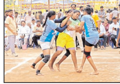
అంగరంగ వైభవంగా రెండవ రోజు కబడ్డీ టోర్నీ పోటీలు జరిగాయి. సత్తెనపల్లి నియోజక వర్గంలోని గ్రామీణ ప్రాంతాల్లో "యువతి యువ తలను"