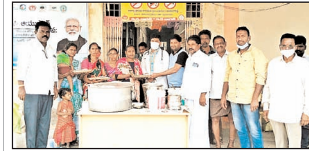
పెదకూరపాడు, మేజర్ న్యూస్

మాగులూరి ఫౌండేషన్ ఆధ్వర్యంలో మంగళవారంపలు మండలాల ప్రాథమిక ఆరోగ్య కేంద్రాలలో పరిక్షల నిమిత్తం హాజరయ్యే గర్భిణీ స్త్రీలకు పాష్టికాహారం అందజేశారు. పెదకూరపాడు మండల స్థానిక ప్రాథమిక ఆరోగ్య కేంద్రంలో మరియు సత్తెనపల్లి మండలంలోని ఫణిదం ప్రాథమిక ఆరోగ్య కేంద్రంలో వైద్య పరిక్షలు నిమిత్తం హాజరైన గర్భిణీలకు పాష్టికాహారాన్ని అందజేశారు.అనంతరం పాష్టిక ఆహారంతో పాటు అన్నదానం కార్యక్రమాన్ని కూడా నిర్వహించారు. ప్రతివారం గర్భిణీ స్త్రీలకు మాగులూరి ఫౌండేషన్ ద్వారా పాష్టికాహారాన్ని అందించడం ఎంతో అభినందనీయమని ప్రాథమిక ఆరోగ్య కేంద్రాల వైద్యులు వారి సేవలను కొనియాడారు. ఈ కార్యక్రమంలో ఫౌండేషన్ సభ్యులు వైద్యాధికారులు గర్భిణీలు పాల్గొన్నారు.