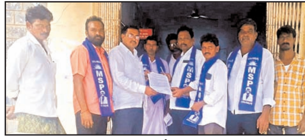
రెంటుచింతల, మేజర్ న్యూస్