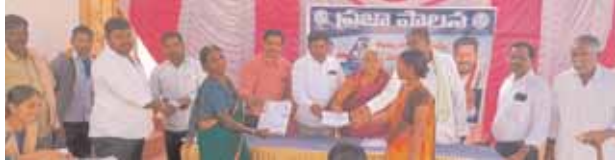
ప్రజా పాలన దరఖాస్తులను స్వీకరిస్తున్న దృశ్యం