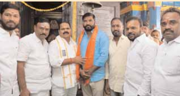
నీరటి వాసును ఆశీర్వాదించును ఎమ్మెల్యే వీరవల్లి శంకర్