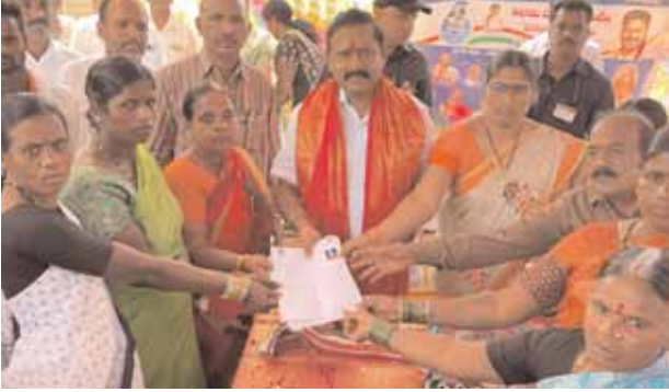
ధరఖాస్తులను స్వీకరిస్తున్న దృశ్యం

చౌదాపూర్ మేజర్ న్యూస్ (జనవరి 02): కాంగ్రెస్ ప్రభుత్వం చేపట్టిన 6 గ్యారంటీలపై ఎలాంటి అపోహలు వండోద్దని పక్కాగా ఆరు గ్యారెంటీలు అమలు చేస్తామని పరిగి ఎమ్మెల్యే రామ్మోహన్ రెడ్డి అన్నారు. మంగళవారం చౌదాపూర్ మండల పరిధిలోని విరలాపూర్ గ్రామంలో నూతన గ్రామపంచాయతీ భవనాన్ని ప్రారంభించారు. అనంతరం ప్రజాపాలన కార్యక్రమాన్ని ప్రారంభించి ప్రజలతో దరఖాస్తులు స్వీకరించారు. అనంతరం చౌదాపూర్ మండల కేంద్రంలో స్థానిక తహసీల్దార్ ప్రభులు ఆధ్వర్యంలో ఎమ్మెల్యే రామ్మోహన్ రెడ్డి కళ్యాణ లక్ష్మి చెక్కులు పంపిణీ చేశారు. వీరాపూర్ కన్యకా కాల్య గ్రామంలో ప్రజా పాలన కార్యక్రమాన్ని ప్రారంభించి గ్రామస్తులచే దరఖాస్తులు స్వీకరించారు. ఈ