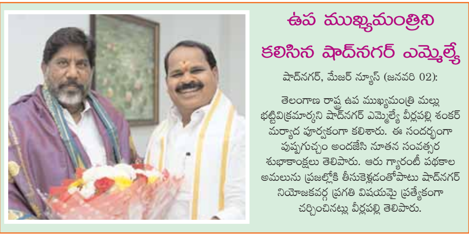
ఉప ముఖ్యమంత్రిని కలిసిన షాద్ నగర్ ఎమ్మెల్యే షాద్ నగర్, మేజర్ న్యూస్ (జనవరి 02): తెలంగాణ రాష్ట్ర ఉప ముఖ్యమంత్రి మల్లు భట్టివిక్రమార్కుని షాద్ నగర్ ఎమ్మెల్యే వీర్లపల్లి శంకర్ మర్యాద పూర్వకంగా కలిశారు. ఈ సందర్భంగా పుష్పగుచ్ఛం అందజేసి నూతన సంవత్సర శుభాకాంక్షలు తెలిపారు. ఆరు గ్యారంటీ పథకాల అమలును ప్రజల్లోకి తీసుకెళ్లడంతోపాటు షాద్ నగర్ నియోజకవర్గ ప్రగతి విషయమై ప్రత్యేకంగా చర్చించినట్లు వీర్లపల్లి తెలిపారు.