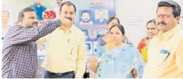
నూతన సంవత్సర వేడుకలు జరుపుకుంటున్న అధికారులు