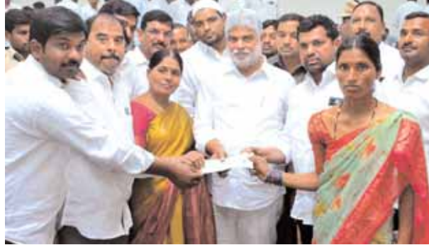
కల్యాణ లక్ష్మి చెక్కులను పంపిణీ చేస్తున్న దృశ్యం.

వికారాబాద్ జిల్లా ప్రతినిధి, మేజర్ న్యూస్ (జనవరి 02): వచ్చే ఐదు సంవత్సరాలలో మూడు వేల కోట్ల రూపాయల నిధులతో వికారాబాద్ జిల్లాను అన్ని రంగాలలో అభివృద్ధి పరుస్తానని రాష్ట్ర శాసనసభ స్పీకర్ గడ్డం ప్రసాద్ కుమార్ అన్నారు. మంగళవారం స్థానిక అంబేద్కర్ భవనములో ఏర్పాటు చేసిన కల్యాణ లక్ష్మి, షాదీ ముబారక్ చెక్కుల పంపిణీ కార్యక్రమంలో ఆయన ముఖ్యఅతిథిగా పాల్గొన్నారు. ఈ సందర్భంగా మాట్లాడుతూ... గత పది సంవత్సరాలుగా జిల్లా అన్ని రంగాలలో వెనుకబడిపోయిందని, రాబోవు రోజులలో నియోజకవర్గ ప్రజలందరికీ అన్నలా ఉండి జిల్లాను అభివృద్ధి పరుస్తానని తెలిపారు. ప్రాణహిత చేవెళ్ల, పాలమూరు - రంగారెడ్డి ఎత్తిపోతల పథకాలకు గత పాలకులు అన్యాయం చేశారని, ఈ ప్రాజెక్టులను పూర్తి చేసి జిల్లా ప్రజలకు సాగు, త్రాగునీరు అందించే దిశగా ముందుకు వెళ్తామన్నారు. జిల్లాలోని పంచాయతీరాజ్, రోడ్లు మరియు భవనాల రహదారులన్నీ అస్తవ్యస్తంగా ఉన్నాయని రోడ్ల నిర్మాణం కోసం రూ. 300 కోట్ల నిధులను మంజూరు చేయించి అభివృద్ధి పరుస్తామని తెలిపారు. గత పది సంవత్సరాలుగా ప్రజలకు రేషన్ కార్డులు అందలేదని, దరఖాస్తు చేసుకున్న అర్హులందరికీ ముందుగా రేషన్ కార్డులు అందజేస్తామని తెలియజేశారు. రేషన్ కార్డుల తర్వాత ఎన్నికలకు ముందు చెప్పినట్లు 6 గ్యారంటీలను అమలుపరుస్తామని అన్నారు. గత ప్రభుత్వం అప్పులు చేసి రాష్ట్ర ప్రజలపై భారం మోపిందని, వీటన్నింటినీ అధిగమించి ప్రతి