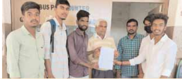
చేవెళ్ల బస్టాండ్ కంట్రోలర్ కు విసతి పత్రం అందజేస్తున్న ఏబీవీపీ నాయకులు