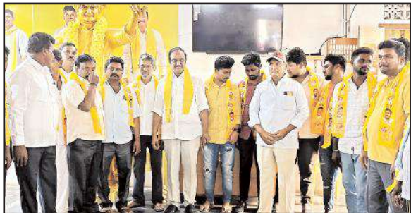
నరసరావుపేట, మేజర్ న్యూస్