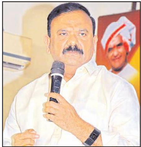
ఇచ్చారన్నారు. యువగళం పాదయాత్రను ఉత్తరాంధ్రలో కొనసాగించాలనుకున్నా టీడీపీ అధినేత చంద్రబాబు నాయుడు ఆక్రమ అరిస్తో అడ్డంకులు ఎదురయ్యాయన్నారు. శంఖారావం పార్టీ కార్యకర్తలు నారా లోకేష్ వైపు మరింత చేరువయ్యేలా చేస్తుందన్నారు. ఈ కార్యక్రమం ద్వారా కార్యకర్తలు నేరుగా నారా లోకేష్ పై తమ అభిప్రాయాలను పంచుకునే అవకాశం ఉంటుందన్నారు.