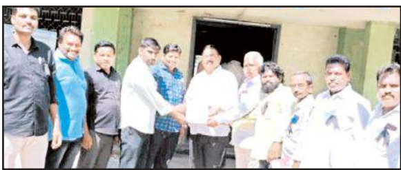
చిలకలూరిపేట, మేజర్ న్యూస్