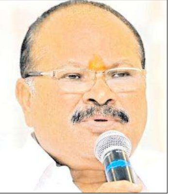
పన్నీరును చేశాడు ఈ సైకో సీఎం. అమరావతి రైతుల ఉసురు పోసుకున్నాడు జగన్ రెడ్డి. రాష్ట్రం

కోసం, ప్రజల కోసం తీసిన సినిమాను సిఎం అడ్డుకోవడం దారుణం. 5 కోట్ల ఆంధ్రుల కలల రాజధానిని ఛిద్రం చేసిన తుగ్లక్ సీఎం జగన్. మూడు రాజధానుల పేరుతో ఆంధ్రులను మోసం చేసిన మూరు?డు జగన్. ప్రాంతాల పేరుతో ప్రజలను విడగొట్టి, రాజకీయ లబ్ధి పొందాలని చూశాడని “కన్నా” విమర్శించారు. అసెంబ్లీ సాక్షిగా అమరావతికి మద్దతు తెలిపిన జగన్ రెడ్డి అధికారంలోకి వచ్చాక మూడు రాజధానుల పేరుతో మాట మార్చారు. మదమ తిప్పని నేత ఆంధ్రుల రాజధాని అమరావతిపై యూటర్న్ ఎందుకు తీసుకున్నాడో చెప్పాలన్నారు. జగన్ రెడ్డికి ఓటమి భయం పట్టుకుంది. కాబట్టే ఇలాంటి వివరీత బుద్ధులు పుట్టాయి. తెలుగుదేశం పార్టీకి వస్తున్న మైలేజ్ ను చూసి ఓర్వలేక సైకో చేష్టలు