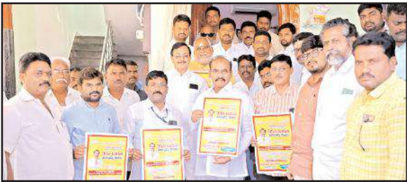
చిలకలూరిపేట, మేజర్ న్యూస్