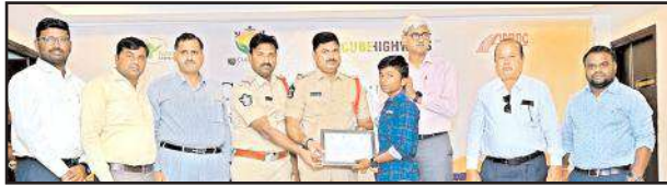
పిడుగురాళ్ల టౌన్, మేజర్ న్యూస్