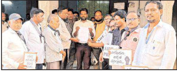
గురజాల, మేజర్ న్యూస్