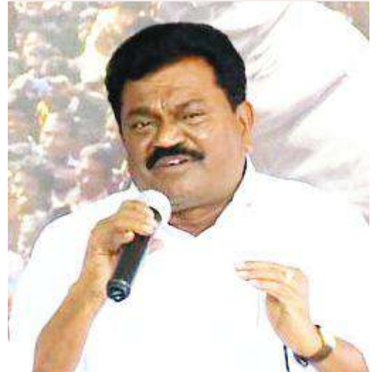
దాచేపల్లి, మేజర్ న్యూస్

మండలంలోని గ్రామాలపాడులో జరిగే ప్రభుత్వ ఆసరా కార్యక్రమానికి అధికారులు ప్రొటోకోల్ పాటించలేదని ఎమ్మెల్సీ జంగా కృష్ణమూర్తి ఆగ్రహం వ్యక్తం చేశారు. ఆదివారం ఆసరా కార్యక్రమం నిర్వహించేందుకు అధికారులు సమాయత్తం చేశారు. ఈ సందర్భంగా ఏర్పాటు చేసిన విలేకరుల సమావేశంలో జంగా తప్పు పట్టారు. తన సొంత గ్రామంలో కార్యక్రమం చేసేటప్పుడు చెప్పాల్సిన బాధ్యత మీకు లేదా ఇదేనా మీకు బీసీలపై ఉన్న ప్రేమ అని ప్రశ్నించారు. గ్రామంలో విభజించి పాలించు అన్న చందాన ఎమ్మెల్యే కాసు మహేష్ రెడ్డి పోకడ ఉందన్నారు. ఇదిలా ఉండగా, ఆదివారం వైయస్సార్ ఆసరా చెక్కల పంచెలో కార్యక్రమం జరిపిన మిషన్ ద్వారా ఇంటింటికీ కొలాలు కార్యక్రమానికి శంకుస్థాపన చేయటానికి అధికారులు కార్యక్రమం చేయాలని నిర్ణయించారు. ఈ కార్యక్రమానికి మాకు చెప్పలేదు... జంగా అంటూ ఆవేదన వ్యక్తం చేశారు. ఈ కార్యక్రమం ఇక్కడ నిర్వహించడానికి ఏలేదు అంటూ జంగా అభిమానులు అడ్డుకున్నారు. ఈ విషయంపై స్పందించిన జంగా మా సొంత గ్రామంలో కార్యక్రమం నిర్వహించేటప్పుడు చెప్పాల్సిన బాధ్యత మీకు లేదా అని ప్రశ్నించారు? బీసీలు అంటే ఇంత చిన్నచూపు తగదని హితవు పలికారు. కాలం ఎప్పుడు ఒక లాగే ఉండదు అని దానికి అనుగుణంగా నడుచుకోవాలి అని అన్నారు. పార్టీ కోసం మేము ఎంతో కష్టపడ్డామని పార్టీ స్థాపించిన వారిలో నేను ఒక సభ్యుని అని మొదటి మిగతా 3వ పేజీలో