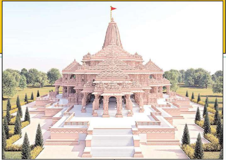
(ద్రవిడ మిశ్రమం) నాగర లేదా ఉత్తర భారత శైలి ప్రధానాంశాలు : రాతి వేదికపై నిర్మించబడింది. బహుళ టవర్లు (శిఖరాలు), లాఠీనా, ఘంసనా, పలభి ఉపరకాలు. ప్రధానంగా ఉత్తర భారతదేశంలో కనిపిస్తుంది. ఉదా. - ఉత్తరప్రదేశ్, మధ్యప్రదేశ్, రాజస్థాన్. మధ్యభారత దేవాలయాలు.

ఆలయ నిర్మాణ శైలులు : ఆలయాల నిర్మాణానికి సంబంధించి మూడు విభిన్న నిర్మాణ శైలులున్నాయి. అవి సగారా (ఉత్తరం), ద్రవిడ (దక్షిణం), మరియు వేసర (నాగారా మరియు