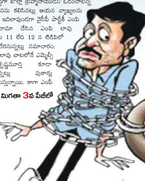
మిగతా 3వ పేజీలో