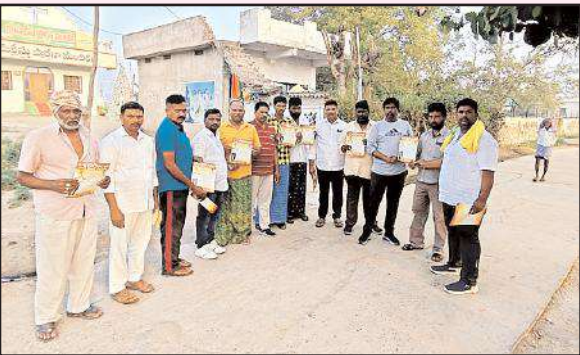
సత్తెనపల్లి ప్రతినిధి, మేజర్ న్యూస్