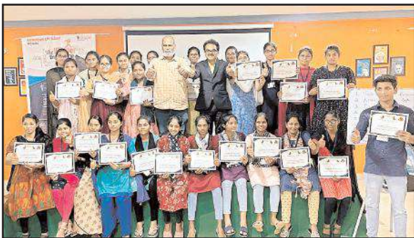
నరసరావుపేట, మేజర్ న్యూస్