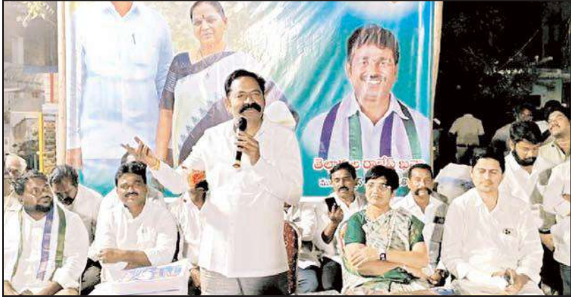
వినుకొండ మేజర్ న్యూస్ నియోజకవర్గం లోని ఆడపడుచులకు శుభాకాంక్షలతో మీ అన్న గా చిరు కాసుకగా చీరలు అంది

పండుగ కాసుక ను అందించటమే ప్రధాన ఉద్దేశం అని శాసనసభ్యులు బొల్ల తెలిపారు. వినుకొండ పట్టణంలోని పలు వార్డుల్లో చీరల పంపిణీ కార్యక్రమం లో పాల్గొన్నారు. ఆయన మాట్లాడుతూ, సంవత్సరం లో తొలి పండుగ పెద్ద పండుగ అయిన సంక్రాంతి పండుగ నాటి నుండి వినుకొండ నియోజకవర్గంలోని ప్రతి ఆడపడుచుకు తాను అన్న గా భావించి పండుగు కాసుక గా చీర పంపిణీ చేయటం ఎంతో సంతోషంగా ఉందని తెలిపారు. పండుగ అందరూ ఎంతో సాంప్రదాయ పద్ధతిలో జరుకుంటారని, రైతులందరికీ ఈ పండుగ ప్రధానమైనదని, అన్నారు. ఆ భగవంతుడి చల్లని దీవెనలు మనందరిపై ఎల్లప్పుడూ ఉండాలని, అందరూ ఆయురారోగ్యాలతో వర్షిల్లాలని మనస్ఫూర్తిగా కోరుకుంటున్నామని తెలిపారు. కార్యక్రమంలో వైఎస్ఆర్ డిఎస్ నాయకులు కార్యకర్తలు ఆయా అవార్డుల మహిళలు పాల్గొన్నారు.