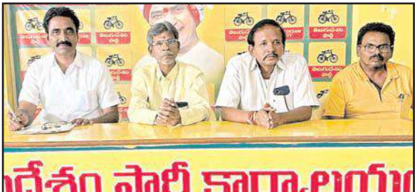
సత్తెనపల్లి ప్రతినిధి, మేజర్ న్యూస్