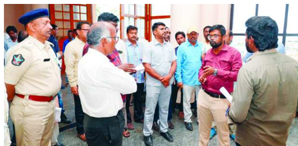
నియోజకవర్గాలకు కేటాయించిన స్ట్రాంగ్ రూములలో పోలింగ్ అనంతరం