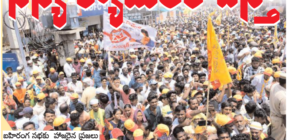
బహిరంగ సభకు హాజరైన ప్రజలు