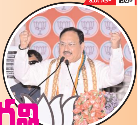
బహిరంగ సభలో ప్రసంగిస్తున్న బిజెపి జాతీయ అధ్యక్షుడు జెపి నడ్డా