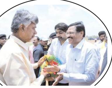
చంద్రబాబుకు స్వాగతం పలుకుతున్న ఇరిగల, భూమా