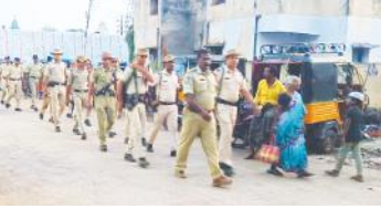
కాకు నిర్వహిస్తున్న బీఎస్ఎఫ్ జవానులు, పోలీస్ సిబ్బంది