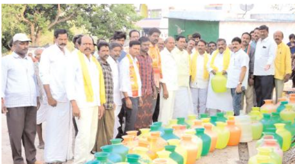
తాగునీరు లేకపోవడం తమ బాధను కోట్లకు చెప్పుకుంటున్న గ్రామీణులు (ఫైల్ ఫోటో)

డోన్, మేజర్స్ న్యూస్ : సార్వత్రిక ఎన్నికల సందర్భంగా ఇప్పుడు రాష్ట్రంలో మూడు నియోజకవర్గాలు రాజకీయంగా అందరి దృష్టిని ఆకర్షిస్తున్నాయి. ఇందులో ప్రధానంగా ముఖ్యమంత్రి వైఎస్ జగన్ పోటీ చేస్తున్న పులివెందుల శాసన సభ నియోజకవర్గం, ఆయన సోదరి పర్వల, సోదరుడు అవినాష్ రెడ్డి పోటీ చేస్తున్న కడప లోక్ సభ నియోజకవర్గంతో పాటు ఆర్థిక మంత్రి బుగ్గన రాజేంద్రనాథ్ రెడ్డి పోటీ చేస్తున్న డోన్ శాసన సభ స్థానం. శాసన సభ స్థానాల విషయానికి వస్తే అభివృద్ధి పనులకు సంబంధించి పులివెందుల, డోన్ నియోజకవర్గాలకు మాత్రమే నిధులు ఎవటికప్పుడు విడుదల అవుతూ వచ్చాయి. కడప లోక్ సభ స్థానంలో జగన్ సొంత చెల్లి పర్వల, బాబాయి కుమారుడు అవినాష్ రెడ్డిలు పోటీ చేస్తుండటంతో ప్రాధాన్యత సంతరించుకున్నారు. ఇక ఆర్థిక మంత్రి బుగ్గన రాజేంద్రనాథ్ రెడ్డి పోటీ చేస్తున్న డోన్ నియోజకవర్గంలో అభివృద్ధి సైతం బయటి ప్రాంతాల వారిని విశేషంగా ఆకట్టుకుంది. అయితే స్థానికంగా మాత్రం ప్రజలను ఆయన చేసిన అభివృద్ధి పనులు ఆకట్టుకోలేదు. బుగ్గన తన అధికారాన్ని ఉపయోగించి డోన్, బేతంచెర్ల, ప్యాపిలి మండల కేంద్రాల్లో పాలిటెక్నిక్ కళాశాలలను ఏర్పాటు చేశారు. వీటికి సొంత భవనాలను కూడా నిర్మిస్తున్నారు. ఇక బేతంచెర్లలో విద్యా భవనాల సముదాయం పేరుతో ఒకే చోట పలు విద్యాలయాలకు నూతన భవనాల నిర్మాణం కొనసాగుతోంది. డోన్ పట్టణంలో ఒక 100 సడకల ఆసుపత్రి నిర్మించి భవనాన్ని నిర్మించారు. ఇంత వరకు బాగానే ఉంది. ఇవన్నీ కనిపించే అభివృద్ధిగా చెప్పుకున్నా కరువుకు నిలయమైన డోన్ నియోజకవర్గంలో తాగు, సాగు నీటి సమస్యకు మాత్రం ఒక పరిష్కారం చూపలేదని స్థానిక ప్రజలు తీవ్ర అసంతృప్తిని వ్యక్తం చేస్తున్నారు. నియోజకవర్గంలో