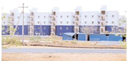
రంగులు వేసి లబ్ధిదారులకు ఇవ్వని డోన్ పట్టణంలోని టిడికో గృహాలు (ఫైల్ ఫోటో)

నిర్మిస్తే తాగునీటి సమస్యను ఎవరు పరిష్కరిస్తారని వారు ప్రశ్నిస్తున్నారు. ఇక హంద్రీ%-నివా కాలనీ నుంచి డోన్ నియోజకవర్గానికి సాగునీటిని అందించే విషయంలో కూడా ఆయన విఫలమయ్యారన్న ఆరోపణలు ఎదుర్కొంటున్నారు. ఇక డోన్ పట్టణంలో 2014%-2019 మధ్య తెలుగుదేశం ప్రభుత్వం నిర్మించిన టిడికో ఇళ్ల సముదాయం నాటి ప్రభుత్వం ప్రారంభించినా తరువాత ఏర్పాట్లైన ప్రభుత్వం వాటిని లబ్ధిదారులకు ఇవ్వలేదని ప్రజల్లో అసంతృప్తి నెలకొని ఉంది. ప్రభుత్వం ఏర్పాట్లైన తరువాత గతంలో ఇళ్లు మంజూరైన లబ్ధిదారుల తొలగించి వైసిపి సూచించిన వారికి జాబితాలో చోటు కల్పించడంతో కొందరు లబ్ధిదారులు కోర్టును ఆశ్రయించారు. దీంతో ఇళ్లను లబ్ధిదారులకు అందించడంలో బుగ్గన సఫలం కాలేదని ప్రజలంటున్నారు. మరో వైపు వైసిపి ప్రభుత్వం ఏర్పాట్లైన తరువాత జగనన్న కాలనీల పేరుతో ఇంటి