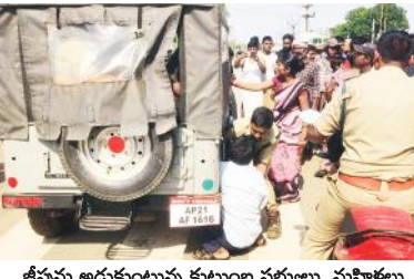
జీపును అడ్డుకుంటున్న కుటుంబ సభ్యులు, మహిళలు