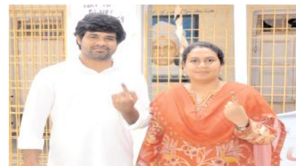
ఓటు హక్కు వినియోగించుకున్న జేసీ దంపతులు