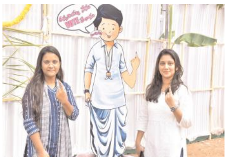
తస్మాదియ్య నేను ఓటు వేసా అంటూ యువతులు

అయితే, సగటున 75 శాతం మించేట్లు కనిపించలేదు. ఉమ్మడి కర్నూలు జిల్లాలో రెండు పార్లమెంట్, 14 అసెంబ్లీ నియోజకవర్గాలకు ఎన్నికలు జరిగాయి. 34,43,870 మంది ఓటర్లు ఓటు హక్కు వినియోగించుకోవలసి ఉంది. ఉమ్మడి జిల్లాలో 3,915 పోలింగ్ కేంద్రాలు ఏర్పాటు చేశారు. నంద్యాల జిల్లాలో పోలింగ్ కేంద్రాలకు జనం పోటెత్తగా, కర్నూలు జిల్లాలో సాధారణంగా కనిపించింది. సోమవారం సాయంత్రం 5 గంటల ముగిసే సమయానికి నంద్యాల జిల్లాలో సగటున 71.54 శాతం ఓటర్లు ఓటు హక్కు వినియోగించుకోగా, కర్నూలు జిల్లాలో ఇది 64.55 శాతంగా ఉంది. సాయంకాలం 6 గంటల వరకు ఓటు హక్కు వినియోగించుకునే అవకాశం ఉండడంతో ఉమ్మడి జిల్లా వ్యాప్తంగా పోలైన ఓట్ల శాతం అందేందుకు సోమవారం అర్ధరాత్రి దాటవచ్చని భావిస్తున్నారు. కర్నూలు, నంద్యాల జిల్లాల్లో ముఖ్యంగా కర్నూలు, నంద్యాల, ఆదోని, ఎమ్మిగనూరు లాంటి పట్టణాల్లో చివరి ఓటు పూర్తయ్యేవరకు రాత్రి 11 గంటలు దాటుతుందని అంచనా వేస్తున్నారు. సోమవారం తెల్లవారుజాము నుండి వర్షం ప్రారంభం కావడంతో పోలింగ్ కు ఇబ్బంది కలుగుతుందని భావించినా సరిగ్గా పోలింగ్ ప్రారంభమయ్యే సమయానికి వర్షం తగ్గిపోవడంతో అంతా ఊపిరి పీల్చుకున్నారు. వర్షం తగ్గిన వెంటనే పోలింగ్ కేంద్రాలకు జనం పోటెత్తారు. గత నాలుగు రోజులుగా ఎండ తీవ్రత అధికంగా ఉండడం పోలింగ్ శాతంపై ప్రభావం చూపించే అవకాశం ఉందని భావించినా ఒక్కసారిగా వాతావరణం చల్ల బడింది. అయితే 2014, 2019 ఎన్నికలతో పోలిస్తే పోలింగ్ శాతం పెరిగినా అంత ఆశాజనకంగా కనిపించలేదు. 2019 ఎన్నికల్లో ఓటు హక్కు వినియోగించుకునేందుకు సాయంత్రం 5 గంటల వరకే సమయం ఉండగా, వేసవి తీవ్రత కారణంగా 2024