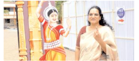
ఓటు హక్కు వినియోగించుకున్న కలెక్టర్ జి.నృజన