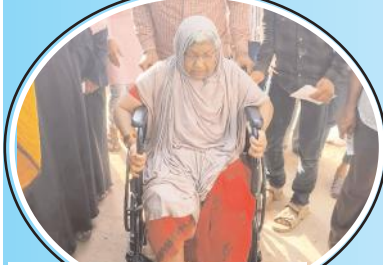
ఓటు వేసేందుకు వచ్చిన వ్యధురాలు