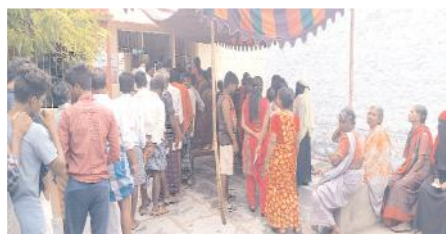
మొలగపల్లిలో క్యూలో నిలబడిన ఓటర్లు

అలూరు, మేజర్ న్యూస్: కర్నూలు జిల్లా అలూరు నియోజకవర్గంలో సార్వత్రిక ఎన్నికలు ప్రశాంతంగా జరిగాయి. ఎన్నికల్లో తమ ఓటు హక్కును ఆయా పార్టీల నాయకులు వినియోగించుకున్నారు. అలూరు నియోజకవర్గంలో దేవనకొండ, ఆస్పర్ల మండలాలలో ఓటింగ్ కొంచెం నెమ్మదించినా అనుకున్న టార్గెట్ ను మాత్రం పూర్తి చేశారు. ఉదయం 7 గంటల నుండి