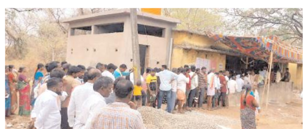
కూలైన్ లో వేచివున్న ఓటర్లు