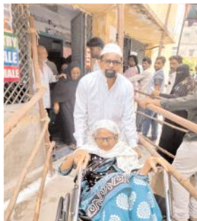
102ఏళ్ల వృద్ధురాలు ఓటు వినియోగించుకొని వస్తున్న దృశ్యం