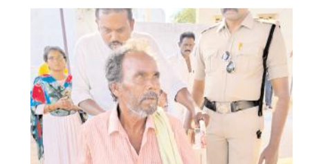
ఓటు వేసేందుకు తరలివచ్చిన దివ్యాంగులు