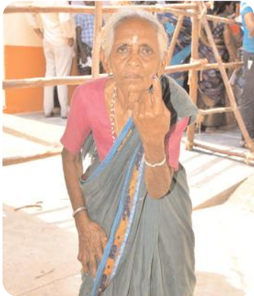
ఓటు వేసేందుకు పోలింగ్ కేంద్రానికి వచ్చిన వ్యక్తులు