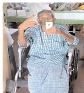
ఓటు వేసేందుకు తరలివచ్చిన దివ్యాంగులు