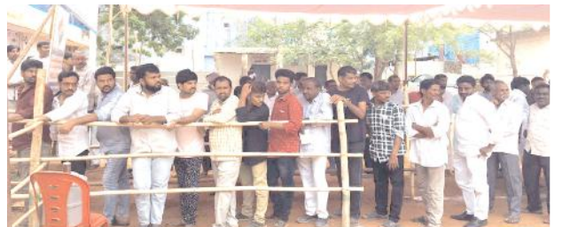
ఓటు వేసేందుకు బారులు తీరిన ప్రజలు