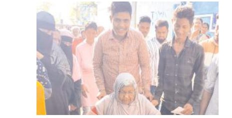
ఓటు వేసేందుకు తరలివచ్చిన దివ్యాంగులు