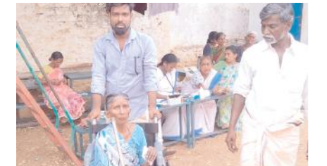
ఓటు వేసేందుకు తరలివచ్చిన దివ్యాంగులు