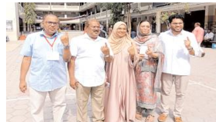
కుటుంబ సమేతంగా ఓటు హక్కు వినియోగించుకున్న ఇందియాజ్