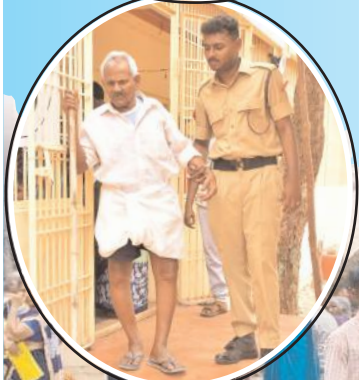
ఓటు వేసేందుకు పోలింగ్ కేంద్రానికి వచ్చిన వ్యధునికి సహాయం చేస్తున్న పోలీస్