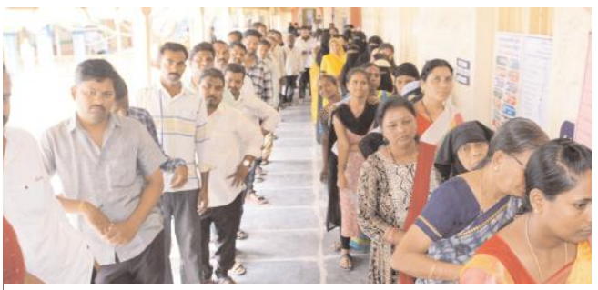
కర్నూలు నగరంలో ఓటు వేసేందుకు క్యూ కట్టిన ఓటర్లు

ఎన్నికల్లో దాన్ని 6 గంటల వరకు పెంచారు. దీంతో కొంత శాతం పెరిగి అవకాశం కనిపిస్తోంది. కర్నూలు, నంద్యాల, ఆదోని లాంటి పట్టణాల్లో ఓటింగ్ శాతం పెంచేందుకు అధికారులు ఎన్ని ప్రయత్నాలు చేసినా పెద్దగా మార్పు కనిపించలేదు. కర్నూలు జిల్లాలో 64.55 శాతం పోలింగ్ : సోమవారం సాయంత్రం 5 గంటల సమయానికి కర్నూలు జిల్లాలో 64.55 శాతం ఓట్లు పోల్ అయ్యాయి. కర్నూలు అసెంబ్లీ నియోజకవర్గంలో 58.15శాతం (2014లో 58.27శాతం, 2019లో 59.53 శాతం), పార్లమెంట్లో 67.02శాతం (2014లో 71.74 శాతం, 2019లో 74.41శాతం), పత్తికొండలో 67.8శాతం (2014లో 78.80శాతం, 2019లో 83.97శాతం), కోడమూరులో 63.14శాతం (2014లో 74.56శాతం, 2019లో 78.77శాతం), ఎమ్మిగనూరులో 68.48శాతం (2014లో 74.47శాతం, 2019లో 79.15శాతం), మంత్రాలయంలో 65.78శాతం (2014లో 78.02శాతం, 84.98శాతం) ఆదోనిలో 59.35శాతం (2014లో 65.28శాతం, 2019లో 65.31 శాతం) అలూరులో 67.27 శాతం (2014లో 75.97శాతం, 2019లో 79.91శాతం) ఓట్లు పోలయ్యాయి. నంద్యాల జిల్లాలో 71.54 శాతం పోలింగ్ : నంద్యాల జిల్లాలో ఆక్షగడ్డ నియోజకవర్గంలో 71.13 శాతం (2014లో 78.31, 2019లో 84.26శాతం), బనగానపల్లెలో 70.83 శాతం (2014లో 82.46 శాతం, 2019లో 80.48శాతం) డోనేలో 78.84శాతం (2014లో 73.34శాతం, 2019లో 78.94 శాతం), నందికొట్కూరులో 67.24శాతం (2014లో 78.30 శాతం, 2019లో 86.98 శాతం), నంద్యాలలో 68.41శాతం (2014లో 71.38శాతం, 2019లో 76.81 శాతం), శ్రీశైలం నియోజకవర్గంలో 71.54 శాతం ఓట్లు (2014లో 80.67శాతం, 2019లో 82.54శాతం) నమోదయ్యాయి. ఇవిఎంలో అభ్యర్థుల భవిష్యత్తు: స్వల్పంగా పెరిగిన ఓట్ల శాతంపై నమ్మకాలు : సార్వత్రిక