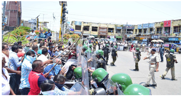
వారితో వాటర్ కెనాన్ వారిపై ప్రయోగించుట, ఫ్లాష్ బాట్స్ పెల్లెట్స్ ఫైరింగ్,

అనుమతితో భాషు వాయువు ప్రయోగించుట, లాఠీ చేతపట్టి చార్జ్ చేపట్టుట, అంతకి పరిస్థితి అదుపులోనికి రానివ్వకపోతే ఆ తర్వాత ఫైర్ డిపార్ట్మెంట్