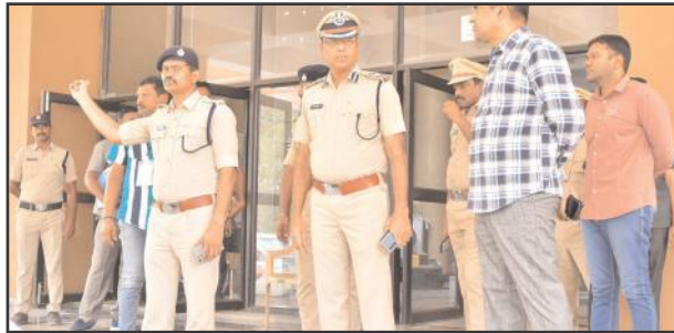
మంచిర్యాల ప్రతినిధి,మే14,సూర్య మేజర్ న్యూస్ :