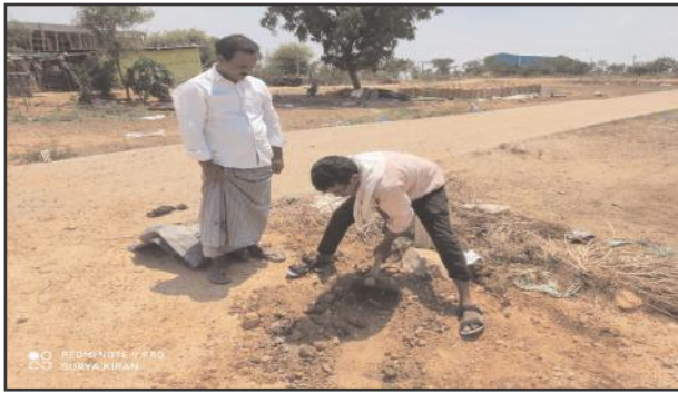
లోకేశ్వరం,మే 14,సూర్య మేజర్ న్యూస్