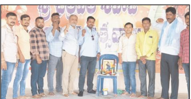
అసిఫాబాద్ ప్రతినిధి 14 మే సూర్య మేజర్ న్యూస్