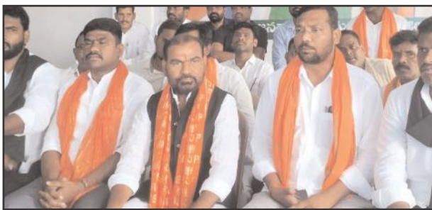
మంచిర్యాల టౌన్, మే 14, సూర్య మేజర్ న్యూస్ :