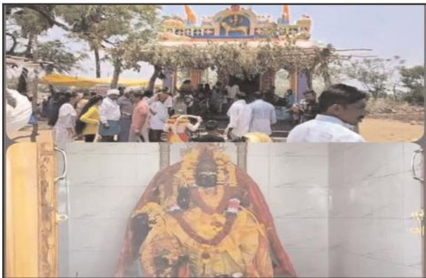
నిర్మల్ ప్రతినిధి ,మే 14, సూర్య మేజర్ న్యూస్

మామడ మండలం పోతారం గ్రామంలో శ్రీ పెద్దమ్మ తల్లి ఆలయ 3వ వార్షికోత్సవం మంగళవారం వైభవంగా నిర్వహించారు. ఉదయం అమ్మవారి విగ్రహానికి వారికి గోదావరి జలాలతో అభిషేకాలతో పాటు విశేష పూజలు చేపట్టారు. మహిళలు ప్రత్యేక పూజలు నిర్వహించారు.గ్రామస్తులు పెద్ద సంఖ్యలో తరలివచ్చి అమ్మవారికి మొక్కులు చెల్లించుకున్నారు. అనంతరం గ్రామ అభివృద్ధి కమిటీ, ఆలయ కమిటీ ఆధ్వర్యంలో భక్తులకు అన్నదాన కార్యక్రమం ఏర్పాటు చేశారు.