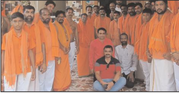
మంచుర్యాల టౌన్, మే 25, సూర్య మేజర్ న్యూస్: