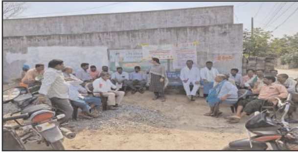
లక్ష్మణ్ణిపేట, మే 25, సూర్య మేజర్ న్యూస్

... నకిలీ విత్తనాల పట్ల రైతులు జాగ్రత్తగా ఉండాలని అవగాహన కార్యక్రమం