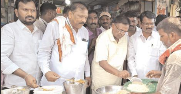
బెల్లంపల్లి, మే 25, సూర్య మేజర్ న్యూస్: