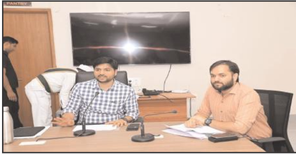
ఆసిఫాబాద్ ప్రతినిధి 27 మే సూర్య మేజర్ న్యూస్

ప్రభుత్వం కమ్మ ఆదర్శ పాఠశాలల కమిటీ ఆధ్వర్యంలో ప్రభుత్వ పాఠశాలలలో చేపట్టిన అభివృద్ధి, మరమ్మత్తు పనులను వేగవంతం చేసి పాఠశాలలు పునః ప్రారంభం అయ్యేలాగా పూర్తి చేసే విధంగా