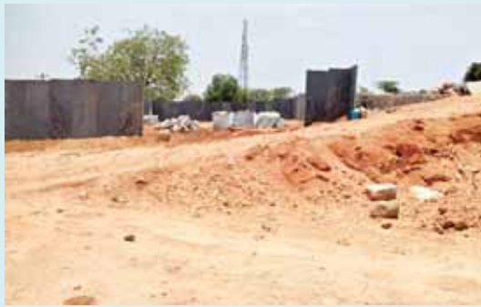
ప్రభుత్వం ఇచ్చిన స్థలంలో వేసిన ప్లాట్లు

అన్నదమ్ములకు గత కొన్ని సంవత్సరాలు కిందట 201 బి సర్వే నెంబరు లో ప్రభుత్వం డి పట్టా కింద 5 ఎకరాల పొలము సాగు చేసుకోవడం కోసం ఇచ్చింది. అయితే అందులో ఒక వ్యక్తి తనకు వచ్చిన వాటాలో కొంత భూమిని చదును చేసుకొని అందులో ప్లాట్లు వేస్తూ ఒక్కొక్క సెంటు 50వేల రూపాయలు చొప్పున విక్రయిస్తున్నాడు. అందులో ఇప్పటికే కొన్ని ప్లాట్లను అదే గ్రామానికి చెందిన కొందరు వ్యక్తులకు నమ్మించి ఎటువంటి రిజిస్టర్ పత్రాలు లేకుండా కేవలం బాండ్ల పైన రాసిస్తూ ప్లాట్లను ఇష్టం వచ్చినట్లు విక్రయిస్తున్నాడు. ఆ ప్లాట్ లను కొనేటవంటి వ్యక్తులు కూడా సొంత గ్రామానికి చెందిన వ్యక్తి అనే నమ్మకంతో మాత్రమే కొంటున్నారు తప్ప ఎటువంటి పత్రాలను చూసి కొనడం లేదు. అంతేకాకుండా ఆ గుట్టలో ఉండేటటువంటి ఎర్రమట్టిని మరియు రాళ్లను నిత్యం ట్రాక్టర్లు ద్వారా ఇతర ప్రాంతాలకు తరలిస్తూ మట్టిని రాళ్లను అమ్ముకుంటూ లక్షల్లో సంపాదిస్తున్నాడు. ఎవరైనా ప్రశ్నిస్తే నాకు రాజకీయ నాయకులు అండదండలు ఉన్నాయంటూ అంటున్నారు.