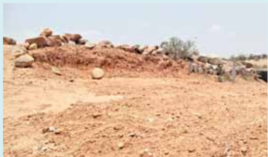
ఎర్రమట్టి తరలింపుచేసే చదునుగా మాలన గుట్ట

అన్ని తెలిసిన నోరు మెదపని రెవెన్యూ అధికారులు : గుంతకల్లు మండలంలోని కసాపురం గ్రామము ఎంతో ప్రసిద్ధిగాంచినది. అక్కడ స్థలాలు భూములకు విపరీతంగా ధరలు పెరిగిపోయాయి. దాంతో అనేకమంది కళ్ళు ప్రభుత్వ భూములు స్థలాలపై పడుతుంది. అందులో భాగంగానే అదే గ్రామానికి చెందిన ఇద్దరూ