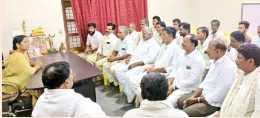
చారు. ఎన్నికల వరకే రాజకీయాలు ఉండాలి ఆ తర్వాత అంత కలిసిమెలిసి ఉండాలి అన్నారు. గ్రామాల్లో రెచ్చగొట్టే వారు ఉంటారని.. వారి మాటలు పట్టించుకోవాల్సిన అవసరం లేదన్నారు..