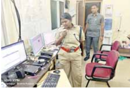
డయల్ - 100 విభాగాన్ని తనిఖీ చేశారు. అర్ధరాత్రి వేళ పోలీసుల సహాయం కోసం ప్రజలు/బాధితుల నుండి వచ్చే ఫోన్ కాల్స్ కు

జెఎన్టీయూలోని వైద్యుల రూంల భద్రత, డయల్ - 100 విభాగం పోలీసుల పనితీరు, స్పందన అర్ధరాత్రి వేళ ఎలా ఉందో జిల్లా ఎస్పీ గౌతమిశాలి ఆకస్మికంగా తనిఖీ చేశారు. అర్ధరాత్రి 2 గంటల సమయంలో వైద్యుల రూంల వద్ద మూడంచెల భద్రతను ఎస్పీ గారు చెక్ చేసి సమీక్షించారు. అనంతరం జిల్లా పోలీసు హెడ్ క్వార్టర్స్ లోని ఈసర్వేలెన్స్ సెంటర్లో నిర్వహిస్తున్న