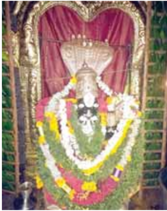
ప్రత్యేక అలంకరణలో శ్రీ లక్ష్మీనరసింహ స్వామి మూల విరాట్