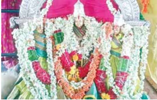
ప్రత్యేక అలంకరణలో శ్రీదేవి, భూదేవి సమేత నరసింహ స్వామి