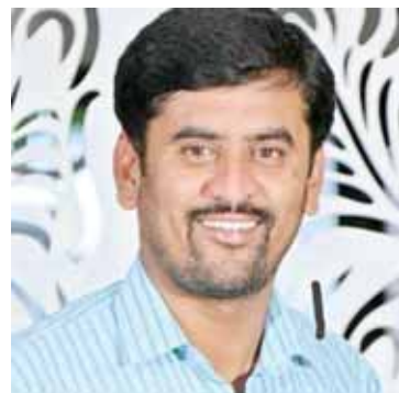
అంతర్ పంట కోసం రైతులు వేసు కొని కంది, మిను ములు, పెసలు, కొర్రలు, రాగి, జీలుగా పిల్ల పెసర్ల, ఉలవలు, అలసందలు వంటి ధాన్యాల కూడా రైతులకు అందుబాటులో ఉంచాలని ప్రభుత్వాన్ని డిమాండ్ చేశారు.