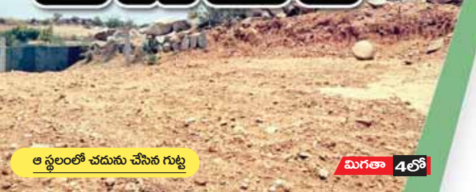
ఆ స్థలంలో చదును చేసిన గుట్ట