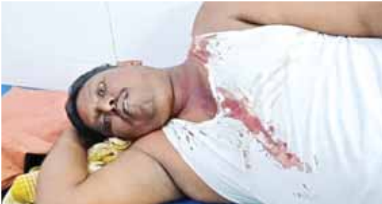
కేసు నమోదు చేసుకుని దర్యాప్తు చేస్తున్నారు.