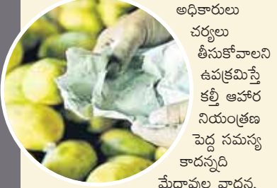
అధికారులు చర్యలు తీసుకోవాలని ఉపక్రమిస్తే కచ్చి ఆహార నియంత్రణ పెద్ద సమస్య కాదన్నది మేధావుల వాదన.

అనేక హోటల్లలో అనుభవం లేని చెప్స్ లు, కుక్ లు మాస్టర్లుగా ఉన్నారు. ఏ వంటకానికీ ఎంత మోతాదులో ఏయే పదార్థాలను కలపాలో సరిగ్గా తెలియని వారు కూడా వంటలు వండేస్తున్నారు. ఆహారం రుచి కథ దేవుడెరుగు.. చూసేందుకు ఆకర్షణీయంగా కనబడేందుకు అవసరానికి మించి రంగులు వాడేస్తున్నారు. ఇక అనేక హోటళ్ల విషయానికొస్తే ఉదయం చేసిన వాటినే నిల్వ ఉండడంతో మధ్యాహ్నం రాత్రిళ్ళు వేడి చేసి వడ్డించేస్తున్నారు. రాత్రి కూడా మిగిలితే ఆ మరునటి రోజుకు వాడేస్తున్నారు. (ఇక మాంసం, నూనె వాడకం సరే సరి. వీటి గురించి మరోసారి సుదీర్ఘంగా తెలుసుకుందాం.) ఫలితంగా ప్రజారోగ్యం ప్రమాదంలో పడుతోంది.