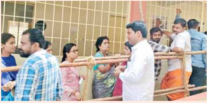
అనంత పార్లమెంట్ పరిధిలో ఎన్నికల సరళని