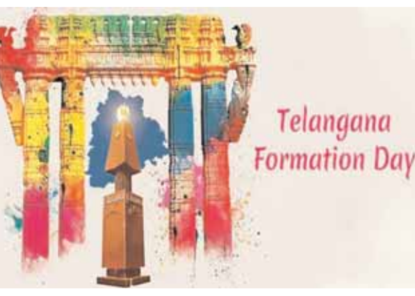
శాఖ అధ్యక్షులతో ఎల్.ఈ.డి స్ట్రీట్ లు, కార్యక్రమ లైవ్ ప్రసారానికి ఏర్పాట్లు చేశారు.

తెలంగాణ బ్యూరో, ప్రతినిధి: తెలంగాణ రాష్ట్ర ఆవిర్భావ వేడుకల నిర్వహణకు ముమ్మరంగా ఏర్పాట్లు జరుగుతున్నాయి. రాష్ట్ర ముఖ్యమంత్రి తోపాటు రాష్ట్ర మంత్రులు, ప్రజాప్రతినిధులు, ఇతర ప్రముఖులు హాజరయ్యే ఈ ఆవిర్భావ వేడుకల నిర్వహణకు సిక్రెటరీజిట్ లోని పరేడ్ గ్రౌండ్ లో వివిధ శాఖలు పెద్ద ఎత్తున ఏర్పాట్లను చేపట్టాయి. ఉదయం ముఖ్యమంత్రి గవ-పార్క్ లో అమరవీరుల స్మారకానికి పూల మాలలు సమర్పించి నివాళులు అర్పించిన అనంతరం సిక్రెటరీజిట్ పరేడ్ గ్రౌండ్ లో పలు కార్యక్రమంలో పాల్గొంటారు. ఈ కార్యక్రమంలో హాజరయ్యే దాదాపు ఇరవై వేలమంది పట్టి భారీ షామియానాలు ఏర్పాటు చేస్తున్నారు. వేసవి ఉండడంతో హాజరయ్యే ప్రజలకు, ప్రముఖులకు ఏమాత్రం ఇబ్బందులు లేకుండా ఉండేందుకు తగు జాగ్రత్త చర్యలు చేపడుతున్నారు. సభా ప్రాంగణంలో ప్రత్యేక మెడికల్ క్యాంపులు ఏర్పాటు కూడా చేస్తున్నారు. తాగునీటి సౌకర్యములు, తగు టాయిలెట్లను కూడా ఏర్పాటు చేస్తున్నారు. సమాచార పౌర సంబంధాల