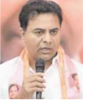
కేటీఆర్ ఆగ్రహం వ్యక్తం చేశారు.