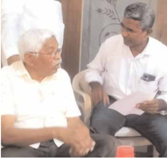
తెలంగాణ బ్యూరో, ప్రతినిధి: మలివిడత తెలంగాణ ఉద్యమంలో కీలకంగా పని చేసిన తెలంగాణ ఉద్యమకారులకు తగిన గుర్తింపు

ట్యాంక్ బండ్ పై కనులపందగా సాంస్కృతిక కార్యక్రమాలు జూన్ 2 వ తేదీన సాయంత్రం ట్యాంక్ బండ్ పై పలు సాంస్కృతిక కార్యక్రమాలు, కార్నాల్, బాణ సనా లో జేర్ షో, వుడ్, గేమింగ్ స్టాళ్ళను ఏర్పాటు చేశారు. ట్యాంక్ బండ్ పై ఏర్పాటు చేసిన పలు సాంస్కృతిక కార్యక్రమాలకు ముఖ్యమంత్రి, మంత్రులు, ఇతర ప్రముఖులు హాజరవుతారు. రాష్ట్రంలోని వివిధ జిల్లాలకు చెందిన పలు సాంస్కృతిక కళా బ్రాండ్లతో కార్నాల్ ప్రదర్శనలు ఉంటాయి. ప్రధాన స్టేజీ పై పలు శాస్త్రీయ, జానపద, దక్కనీ సాంస్కృతిక కార్యక్రమాలు, తెలంగాణ రాష్ట్ర అధికారిక గీతం 'జయ జయహే తెలంగాణ' పై జాతీయ జెండాలో మార్చ్-ఫాస్ట్ నిర్వహిస్తారు. మిరుమిట్ట గాలిపే సైరీ వర్ష ప్రదర్శన : ట్యాంక్ బండ్ పై దాదాపు 80 స్టాళ్ళను ఏర్పాటు చేస్తున్నారు. ఈ స్టాళ్ళలో రాష్ట్రంలోని హస్త కళలు, న్యాయ సహాయక బ్రాండ్లూ తయారు చేసే వస్తువులు, చేనేత ఉత్పత్తులు, సగరం లోని పలు ప్రముఖ హాటళ్ళు వే స్టాళ్ళు ఏర్పాటు. చిన్న పిల్లలకు గేమింగ్ షో ఏ ఏర్పాటు చేశారు.