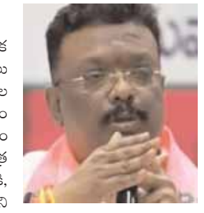
అసెంబ్లీలోనైనా చర్చ జరగాలన్నారు.

తెలంగాణ బ్యూరో, ప్రతినిధి: తెలంగాణ చారిత్రాత్మక ఆనవాళ్లు చెలిపేస్తారా అని బిఆర్ఎస్ సీనియర్ నాయకులు దానో శ్రావణ్ సీఎం రేవంత్ రెడ్డిని ప్రశ్నించారు. ప్రజల జీవితాలలో మార్పు తెస్తానని అధికారం హస్తగతం చేసుకొన్న రేవంత్ రెడ్డి ప్రజాభ్యుదయానికి సంబంధం లేకుండా ప్రభుత్వ గుర్తులను మార్చి తెలంగాణ చరిత్ర ఆనవాళ్ళను తుడిచివేసే పనిలో పడటం తన అపవేదానికి, మార్పులకు ముందుగా మనస్థానానికి పరాకాష్ట అని అన్నారు. ప్రభుత్వాల మారిన ప్రతిసారి ప్రభుత్వ గుర్తులు మార్చడం తుగ్గే చర్య అని అన్నారు. ఒక వేళ రేపే మాటో భవిష్యత్తులో రేవంత్ రెడ్డి ముఖ్యమంత్రి పదవినుండి దిగిపోవాల్సి వస్తే, అతరువాత వచ్చే కొత్త ముఖ్యమంత్రి మరో కొత్త లోగో తేవాల్సి?? ఏంటి తమాషా? ప్రజా పాలన అంటే పిల్లలలాగా ఉందా?? ఒక వేళ మార్చాల్సిన అవసరమే ఉంటే, ప్రజలను ఒప్పియ్యండి, మెప్పియ్యండి అని సూచించారు. అంతే కానీ ముఖ్యమంత్రి మరియే తన సందేహగంధుల స్వంత నిర్ణయం కాకుండా ఉండాలన్నారు. అన్ని పథకాలను సందేహించే నిర్ణయం కావాలని, కనీసం అసెంబ్లీలోనైనా చర్చ జరగాలన్నారు. ప్రజాస్వామ్యంలో ముఖ్యమంత్రి రాజు కాదు ఏది పదితే అది చేయడానికి, కేవలం ప్రధాన సేవకుడు మాత్రమే, అధికార శాశ్వతం కాదన్నారు.