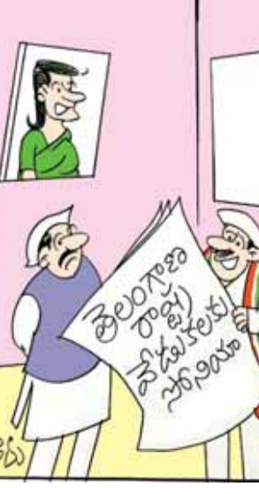
ఇప్పటికైనా తెలంగాణ ఇచ్చింది సోనియానే అని బలంగా చెప్పుకుంటాం