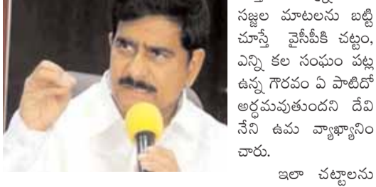
ఇస్సారా అని ప్ర్రించారు. సజ్జల మోటలను బట్టి చూస్తే సైకిలికి చట్టం, ఎన్ఫోర్స్ కేసుల పట్ల ఉన్న గౌరవం ఏ పార్టీలో ఆర్గమవుతుందని దేవి వేని ఉమ వ్యాఖ్యానించారు. ఇలా చట్టాలను అతిక్రమించే వారిని ఉపేక్షించకూడదన్నారు. సజ్జల నోరు అదుపులో పెట్టుకోవాలి. ఓటమి భయంతో కుట్రలు, కుతంత్రాలకు తెరలేపారన్నారు. పైగా సైకిలి బీఫ్ ఏజెంట్లకు సజ్జల చేసిన హితోపదేశంను బట్టి మీడియా పదవీదే ప్రసారం చేసిందని.. ఆయన యాజమాన్యపై ఎన్నికల సంఘం చర్యలు తీసుకోవాలన్నారు. ఏజెంట్లను రెప్పగార్డేలా మాట్లాడటం ద్వారా 1951, ప్రజా ప్రాతినిధ్య చట్టం ప్రకారం ఎన్నికల ప్రవచనాలు నియంత్రించే సజ్జల ఉల్లంఘించాడని దేవిని ఉమ స్పష్టం చేశారు. తాడేపల్లి వేదికగా సైకిలి నేతలు పలువురు రిటర్నింగ్ అధికారులను బెదిరిస్తున్నారని ఆరోపించారు. యుద్ధగండపాలెం రిటర్నింగ్ అధికారికి శ్రీతేజును చెప్పి రెడ్డి భాస్కర్ రెడ్డి చేయి చూపిస్తూ బెదిరించారు. మాకు రూల్స్ చెప్పకూడదు, అడ్డంపడకూ

అమరావతి : నిబంధనలు పాటించే వాళ్ళు కౌంటింగ్ ఏజెంట్లుగా తమకు అవసరం లేదని సజ్జల రామకృష్ణారెడ్డిపై చేసిన వ్యాఖ్యలపై టీడీపీ మండిపడింది. సజ్జల రామకృష్ణారెడ్డిపై చేసిన సంఘం తక్షణమే క్రిమినల్ కేసు పెట్టి అరెస్ట్ చేయాలని టీడీపీ నేత దేవివేని ఉమ డిమాండ్ చేశారు. పార్టీ కార్యాలయంలో నిర్వహించిన మీడియా సమావేశంలో ఆయన మాట్లాడారు. జగన్మోహన్ రెడ్డి , సీఎస్ జవహర్ రెడ్డి డైరెక్ట్ లోనే సజ్జల రెప్పగార్డే వ్యాఖ్యలు చేస్తున్నారని ..జవహర్ రెడ్డి సహకారంతో వీరి ఆలయ సాగుతున్నాయన్నారు. ఇమ్మారాజ్యంగా వ్యవహరిస్తూ నోటికోట్టినట్లు మాట్లాడుతున్నారని మండిపడ్డారు. సీఎస్ పదవీకి మచ్చ తెచ్చి జవహర్ రెడ్డిని తక్షణమే పదవి నుంచి తప్పించాలని టీడీపీ డిమాండ్ చేస్తోందన్నారు. నలభైదారుగా ప్రజల సొమ్ము తింటున్న సజ్జలకు బుద్ధి ఉందా అని దేవివేని ఉమ ప్రశ్నించారు. బద్దేశగా రాష్ట్రాన్ని నర్వ నాశనం చేశారు. ఇప్పుడు ఓటమి భయంతో కౌంటింగ్ రోజున విధ్వంసం సృష్టించేందుకు కుట్రలు చేస్తున్నారని ఆరోపించారు. రూల్స్ ఫాలో ఆయనాళ్ళు తమకు అవసరం లేదని, టీడీపీ-జనసేన ఏజెంట్లకు అడుగుదురగా అడ్డం పడాలని సజ్జల హితోపదేశం చేయడం సిగ్గుచేటున్నారు. ఈమీద ధ్వంసం చేసిన పిచ్చిపిచ్చి చర్యలు తీసుకోమనకుండా ఆ మీడియా ఎలా బయటకు వచ్చిందని సజ్జల ఎదుర్కొన్నారని రాష్ట్రానికి మీరు చేసిన నష్టం చాలదా? తప్పావు చేసినా కాపాడతామని జగన్ సా