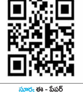
సూర్య ఈ - పేపర్