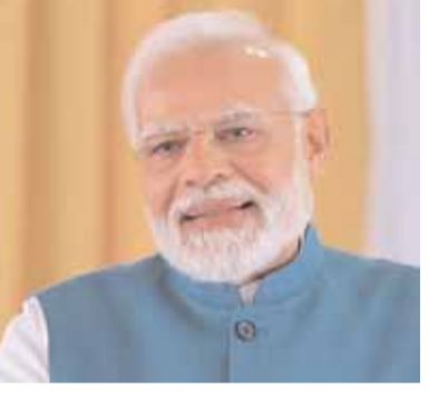
అమరావతి: దేశ వ్యాప్తంగా చివరి, ఏడో దశ ఎన్నికల ప్రచారం గురువారం సాయంత్రం ఆరు గంటలకు ముగిసింది. జూన్ ఒకటిన పోలింగ్ జరగనుంది. ఓట్ల లెక్కింపు దేశ వ్యాప్తంగా జూన్ 4న జరుగుతుంది. ఎన్నికల సందర్భంగా దేశ వ్యాప్తంగా నేతలు అందరూ విస్తృత పోరాటం ప్రచారం చేశారు. పార్టీ గెలుపు కోసం అవిశ్రాంత పోరాటం చేశారు. ఎన్నికల సందర్భంగా ప్రధాని నరేంద్ర మోడీ దేశ వ్యాప్తంగా ప్రచారం చేశారు. ఈ సారి ఎన్నికల షెడ్యూల్ విడుదల చేసిన రోజు మార్చి 16 నుంచి ప్రధాని ఎన్నికల మారఫాన్ నిర్వహించారు. దేశంలో ఎన్నికల సందర్భంగా ప్రధాని నరేంద్ర మోడీ రికార్డు సృష్టించారు. ఎన్నికల షెడ్యూల్ వచ్చిన మార్చి 16 నుంచి మే 30 వరకు 76 రోజుల పాటు ర్యాలీలు, రోడ్ షోలు, సభలు అన్ని కలిపి 206 కార్యక్రమాల్లో ప్రధాని నరేంద్ర మోడీ పాల్గొన్నారు. గత మూడు రోజులుగా రోజుకు ఐదు ప్రచార కార్యక్రమాలు చేపట్టారు. అంతే కాదు గత 22 రోజులుగా రోజుకు నాలుగు చోట్ల ప్రచారం చేశారు. భారతదేశ వ్యాప్తంగా మే నెలలో ప్రధాని 96 ప్రచార కార్యక్రమాలు హాజరయ్యారు. ప్రధాని మోడీ ముఖ్యంగా నాలుగు రాష్ట్రాలపై దృష్టి సారించారు. అత్యధిక లోక్ సభ స్థానాలు (80 స్థానాలు) ఉన్న ఉత్తరప్రదేశ్లో అత్యధికంగా 31 ఎన్నికల కార్యక్రమాల్లో పాల్గొని ప్రసంగించారు. 2019లో యూపీలో ఎన్నిక 64 స్థానాలు గెలుచుకుంది. ఈ సారి కూడా ఆ రాష్ట్రంలో బీజేపీ తన సత్తా చాటాలని లక్ష్యంగా పెట్టుకుంది. ఆ తరువాత బీహార్లో 20 ఎన్నికల ప్రచార కార్యక్రమాల్లో ప్రధాని పాల్గొన్నారు.

మహారాష్ట్ర 19, పశ్చిమ బెంగాల్లో 18 కార్యక్రమాల్లో పాల్గొని ఎన్నిక తరఫున ప్రచారం చేశారు. ఈ సారి పశ్చిమ బెంగాల్లో బీజేపీ తన సభ్యులు పెంచుకోవాలని భావించింది. అందుకే ప్రధాని మోడీ కోల్కతాలో పెద్ద రోడ్ షోతో పాటు 18 ప్రాంతాల్లో ప్రచారం చేశారు. ముంబై, పాట్నాలో ప్రధాని మోడీ రోడ్ షోలతో పాటు జనం తరలివచ్చారు. ఒడిశాలో బీజేపీ ఒంటరిగా వెళ్లాలని నిర్ణయించుకుంది. ముఖ్యమంత్రి నవీన్ పాఠక్కు ఒకే పట్టణం ప్రధాని 10 ర్యాలీలు నిర్వహించారు. పూర్వో భారీ రోడ్ షో నిర్వహించారు. అలాగే మధ్యప్రదేశ్లో 10 ప్రాంతాలు, జార్ఖండ్లో 7 చోట్ల మోడీ ప్రచారం చేశారు. రాజస్థాన్, ఛత్తీస్ఘర్లో నాలుగు ప్రాంతాల చొప్పున ప్రచారం నిర్వహించారు. దక్షిణాది రాష్ట్రాల్లో బీజేపీ ఉనికి కాపాడుకునేందుకు పోరాటం చేసింది. మొత్తం ఐదు రాష్ట్రాల్లో 35 ఎన్నికల ప్రచార కార్యక్రమాలను నిర్వహించారు. ఇందులో కూడా అత్యధికంగా కర్ణాటక, తెలంగాణలో 11 చొప్పున, తమిళనాడులో ఏడు ప్రచారాలు చేశారు. ప్రధాని మోడీ సొంత రాష్ట్రమైన గుజరాత్లో ఆయన ఐదు ప్రచార కార్యక్రమాలను నిర్వహించారు. మే 30న హోషియార్పూర్లో చివరి ప్రచారం ర్యాలీ నిర్వహించారు. పంజాబ్లో నాలుగు, హర్యానాలో మూడు ర్యాలీలు చేపట్టారు. ఢిల్లీ, హిమాచల్ ప్రదేశ్, ఉత్తరాఖండ్లో రెండు చొప్పున ర్యాలీలు చేశారు. నిరంతరాయంగా చేసిన ప్రచారాల్లో మోడీ తన 2019 రికార్డును తెరిచేశారు. 2019 ఎన్నికల సమయంలో ప్రధాని మోడీ దాదాపు 145 బహిరంగ సభలు, ర్యాలీలు నిర్వహించారు.