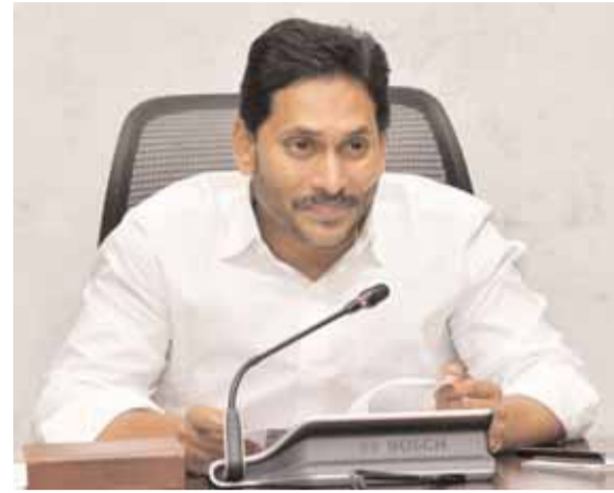
విజయవాడ : ఆంధ్రప్రదేశ్ ముఖ్యమంత్రి వైఎస్ జగన్ మోహన్ రెడ్డి ఓ ఆసక్తికరమైన పోస్ట్ ను సోషల్ మీడియాలో పోస్ట్ చేశారు. దేవుడి దయ, ప్రజలు ఇచ్చిన చారిత్రాత్మక తీర్పుతో సర్కార్ బద్దేశ క్రితం ఇదే రోజున

ఇంటిలిజెన్స్ బిల్లు పనిచేయగా.. 2019 ఎన్నికల సమయంలో ఆయన్ను ఎన్నికల సంఘం బదిలీ చేసింది. ఆ తర్వాత జగన్ సర్కార్ అధికారంలోకి రాగా.. నిఘా పరికరాల కొనుగోళ్ల విషయంలో ఆయన్ను ప్రభుత్వం సస్పెండ్ చేసింది. అయితే ఆయన కోర్టును ఆశ్రయించగా.. విధుల్లోకి తీసుకోవాలని ఆదేశించింది. ఆ వెంటనే ఆయన సీఎస్సీ కలిసి తనకు సోషల్ ఇంజనీర్ గా మారింది. అయితే మళ్లీ ఆయన్ను రెండోసారి కూడా సస్పెండ్ చేసింది ప్రభుత్వం.