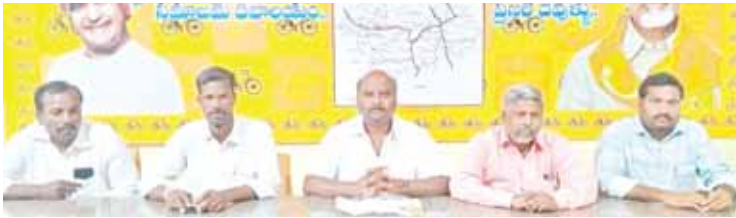
సమావేశంలో మాట్లాడుతున్న తెలుగుదేశం నాయకులు