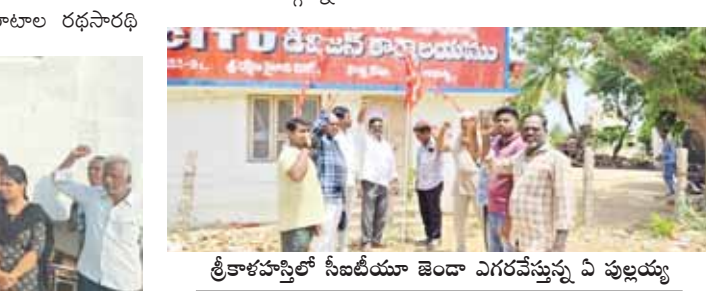
శ్రీకాళహస్తిలో సీబిటియూ జెండా ఎగరవేస్తున్న ఏ పుల్లయ్య