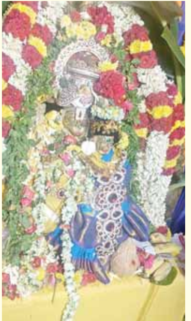
ప్రత్యేక అలంకరణలో శ్రీ లక్ష్మీనరసింహస్వామి