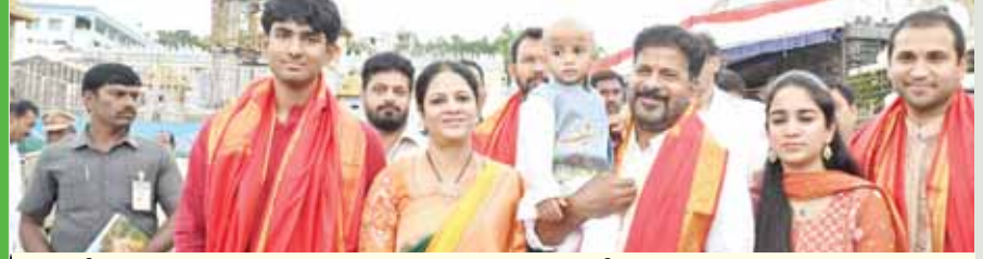
శ్రీవారిని దర్శించుకున్న తెలంగాణ ముఖ్యమంత్రి రేవంత్ రెడ్డి, కుటుంబ సభ్యులు